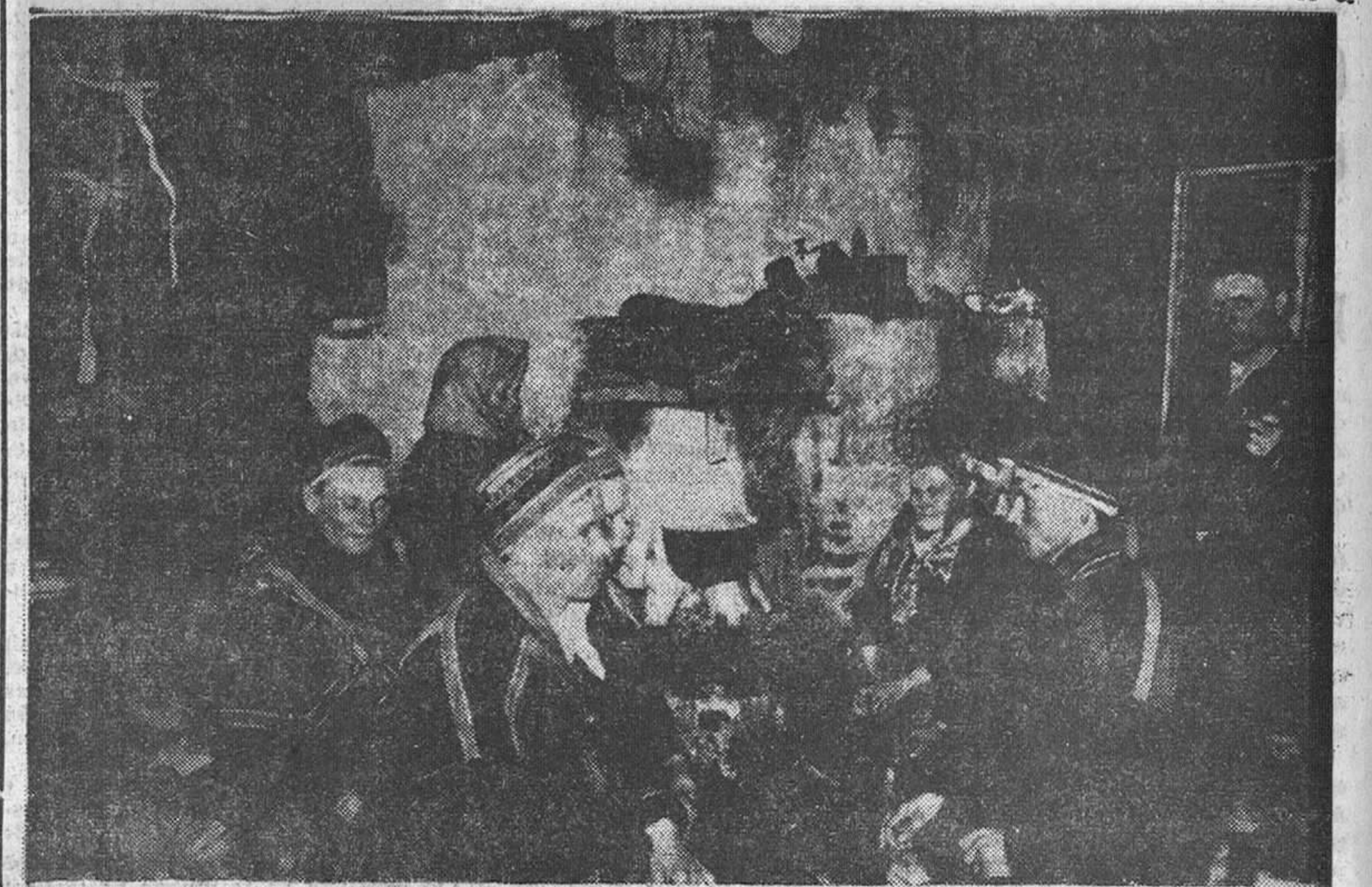
LA CASA DEL "FENNI".—El "fenni", el finlandés, se aventura a veces más allá de las últimas ciudades. Esta casa de un "fenni" es la vanguardia del comercio. A ella van los lapones para cambiar sus pieles por útiles que el "fenni" posee.

fatales consecuencias para el pueblo. Una vez concluidas las fiestas, el lapón permanece en silencio durante varios días, durante los que se dedica a rezar y purificar su alma para que la del oso no le persiga en el trabajo, ni el antepasado que posiblemente residiese en su corazón sea turbado en su sueño.