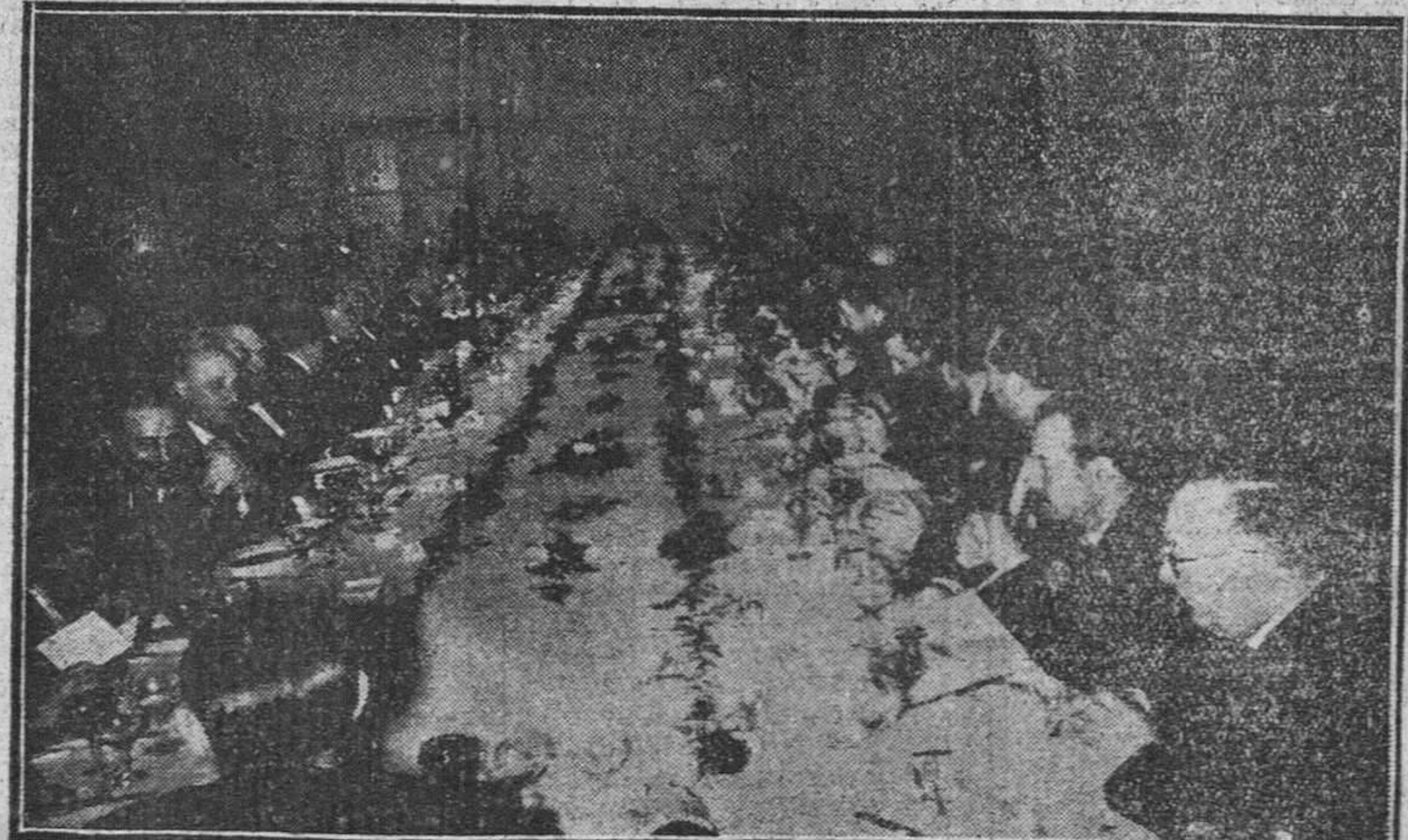
Aspecto que ofrecía la mesa en el momento en que se homenajea a los galardonados con los Premios Nacionales de Periodismo y Literatura instituidos por la Secretaría General del Movimiento, celebrado recientemente en Madrid y que constituyó un acontecimiento cultural de la máxima trascendencia.