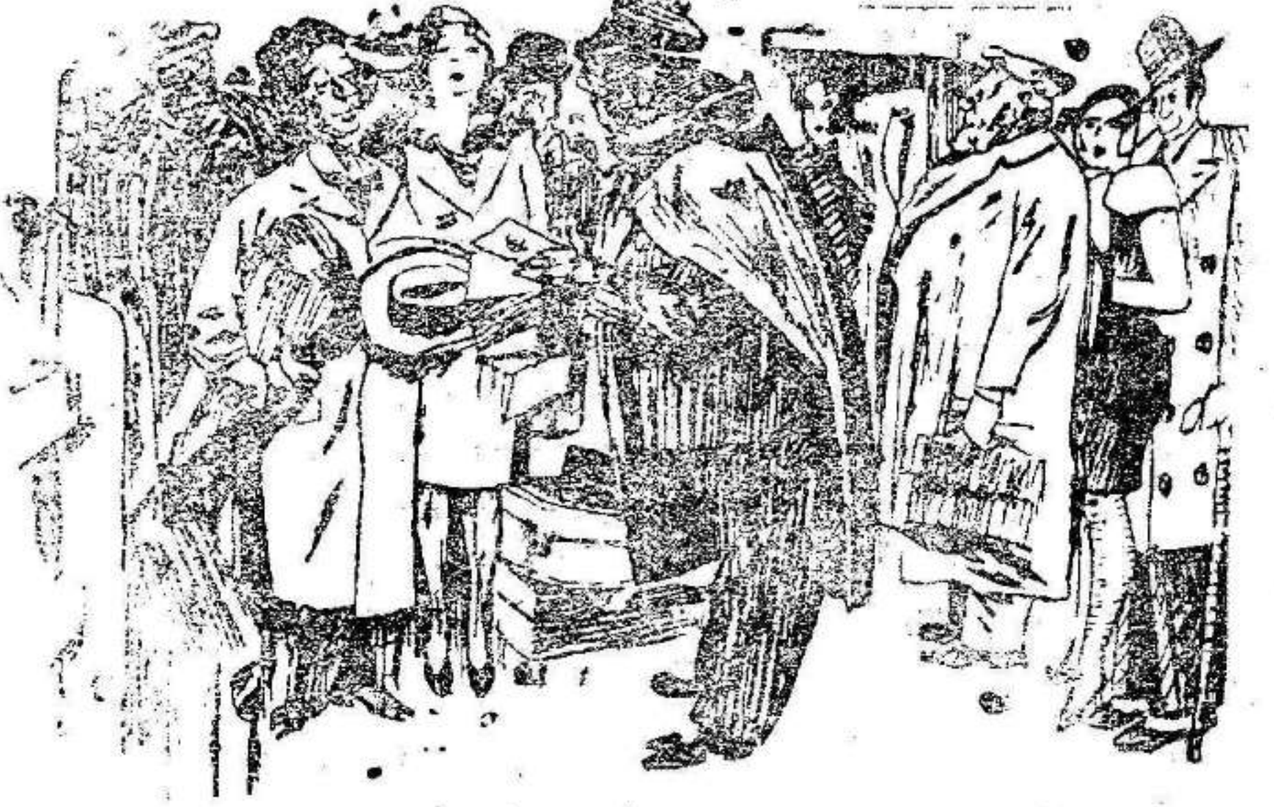
EL DE LA ADUANA.—Tiene usted una magnífica cabellera y el pasaporte dice que es usted calvo. ¿Es, pues, falso el pasaporte? EL VIAJERO.—No. La falsa es la cabellera.