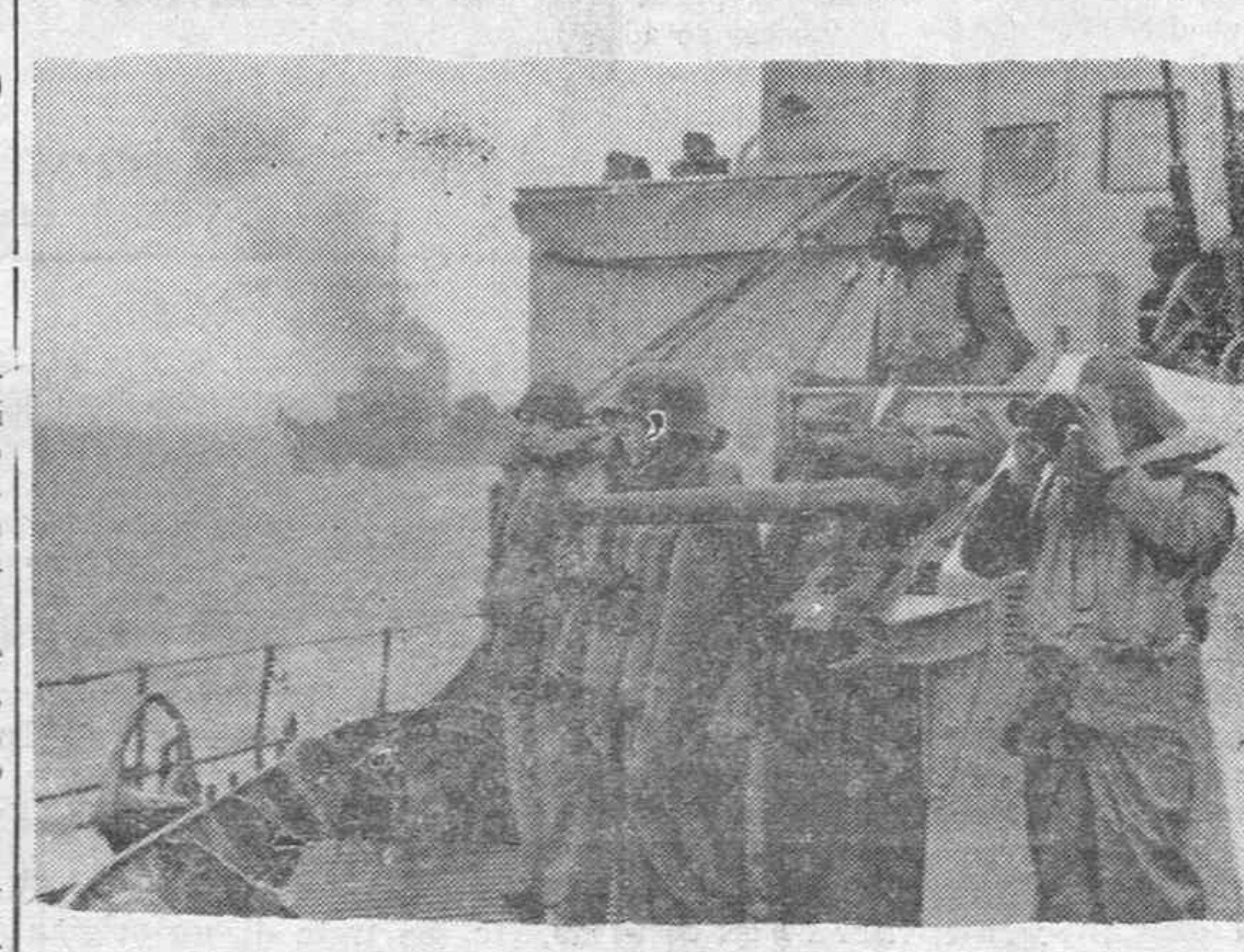
Ha sido dada la alarma por la presencia de unidades de la marina enemiga. Al pie de cada una de las piezas de a bordo, los servidores esperan el momento de actuar.