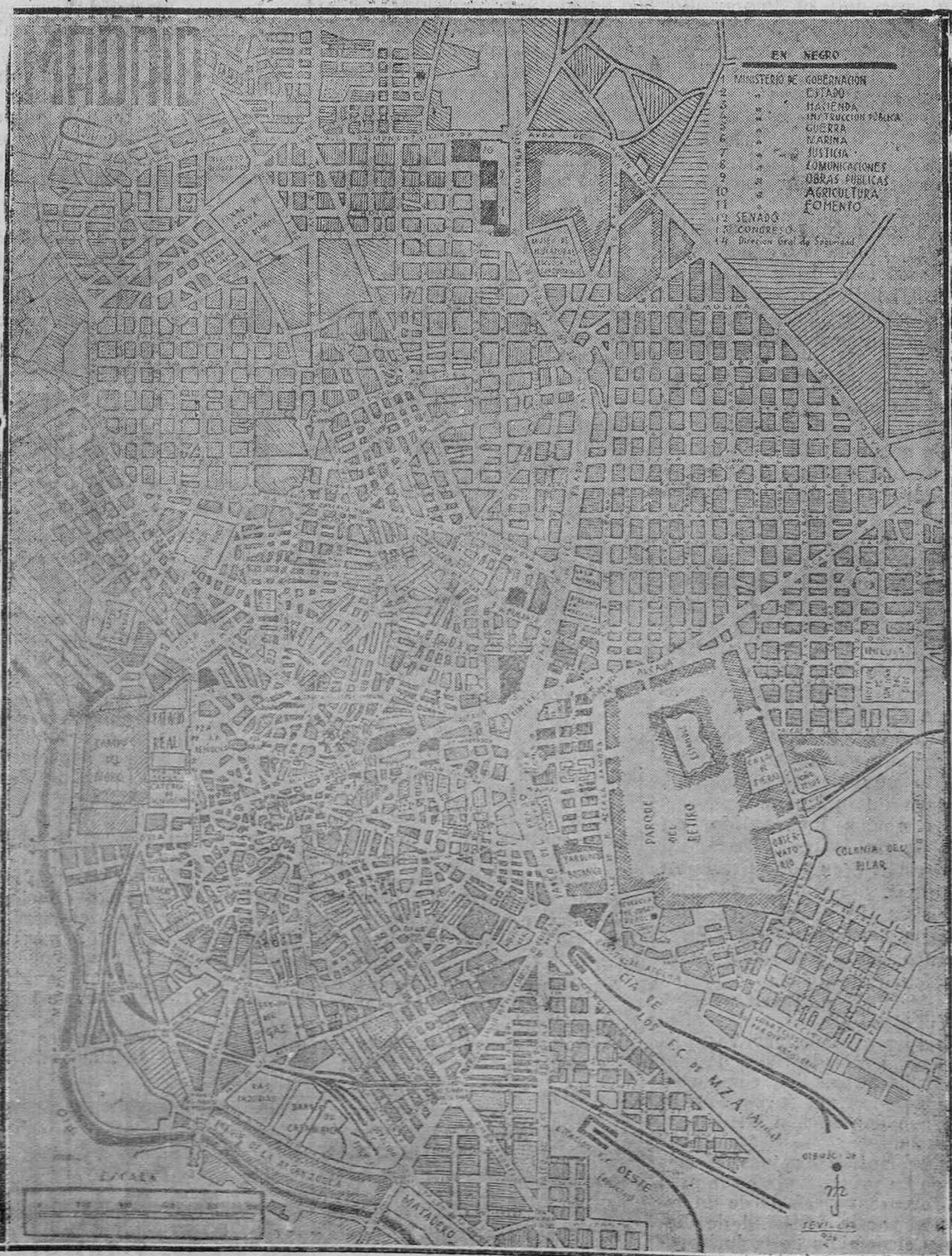
El lector hará bien en recortar este mapa para seguir el curso de las operaciones que ya han comenzado a desarrollarse en el interior de Madrid.