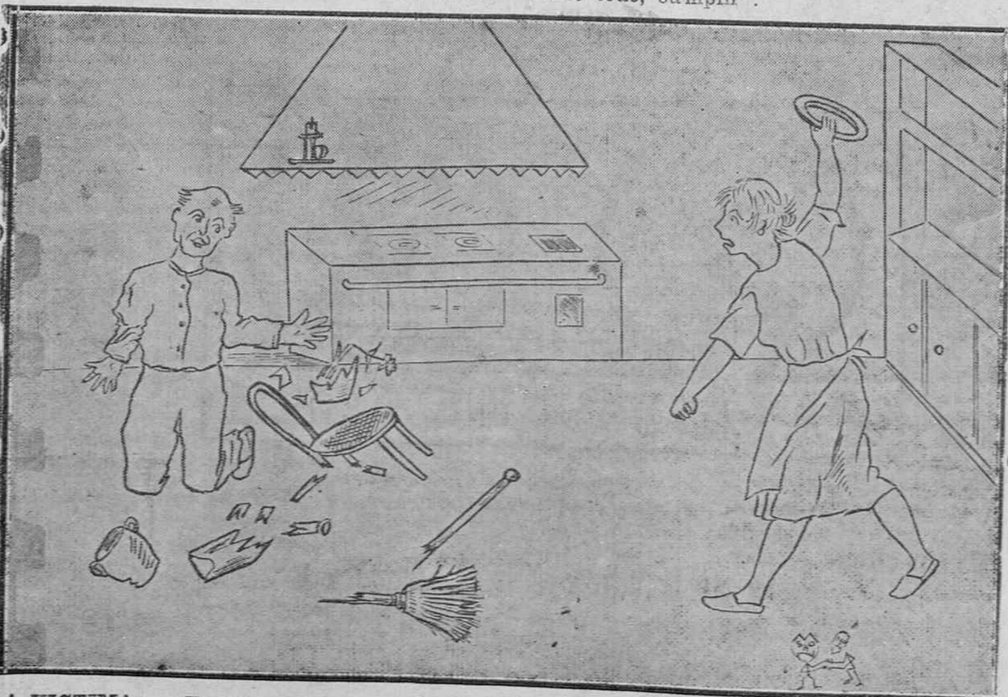
LA VICTIMA: --¡Ese no, mujer, ese no! ¡Que es el "único"...