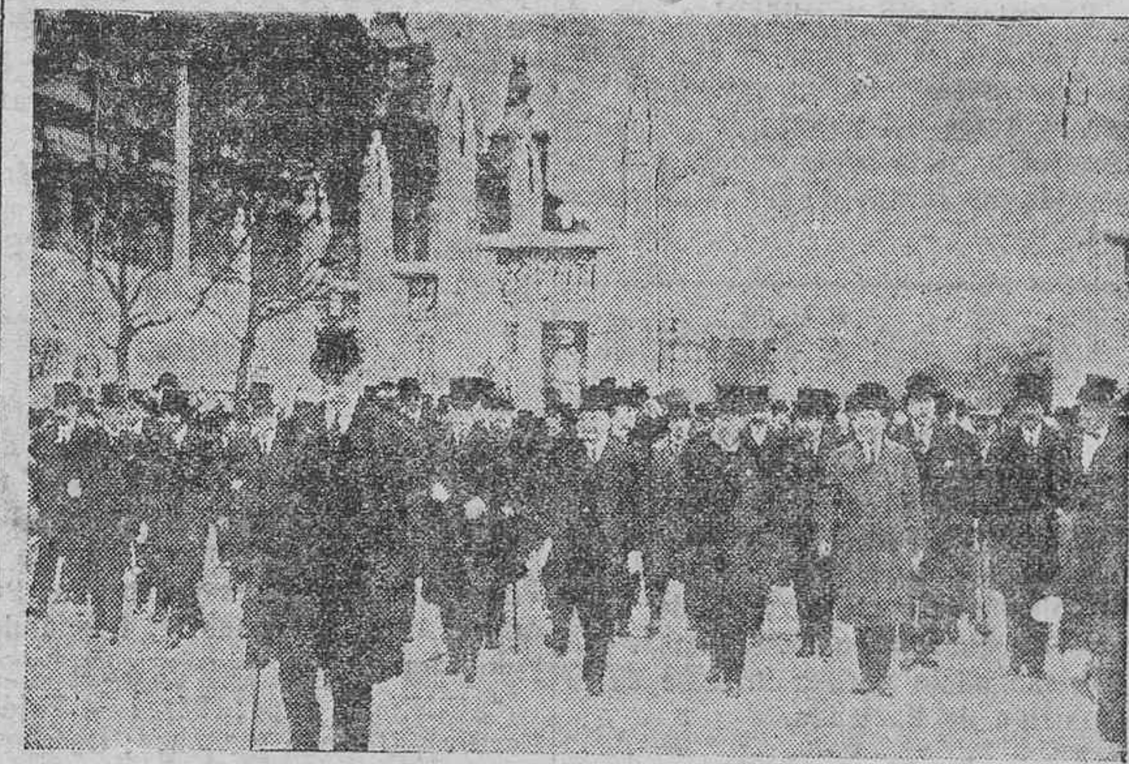
El presidente de la República francesa, M. Doumergue, y la comitiva oficial, inaugurando la gran Exposición de Artes decorativas que constituye la mayor atracción universal del día