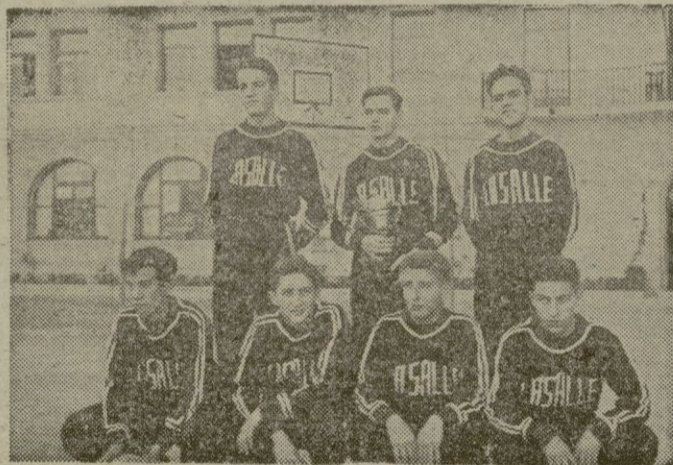
Equipo de baloncesto de "La Salle"

Sabíamos, desde luego que el Colegio La Salle se había proclamado campeón, en las competición