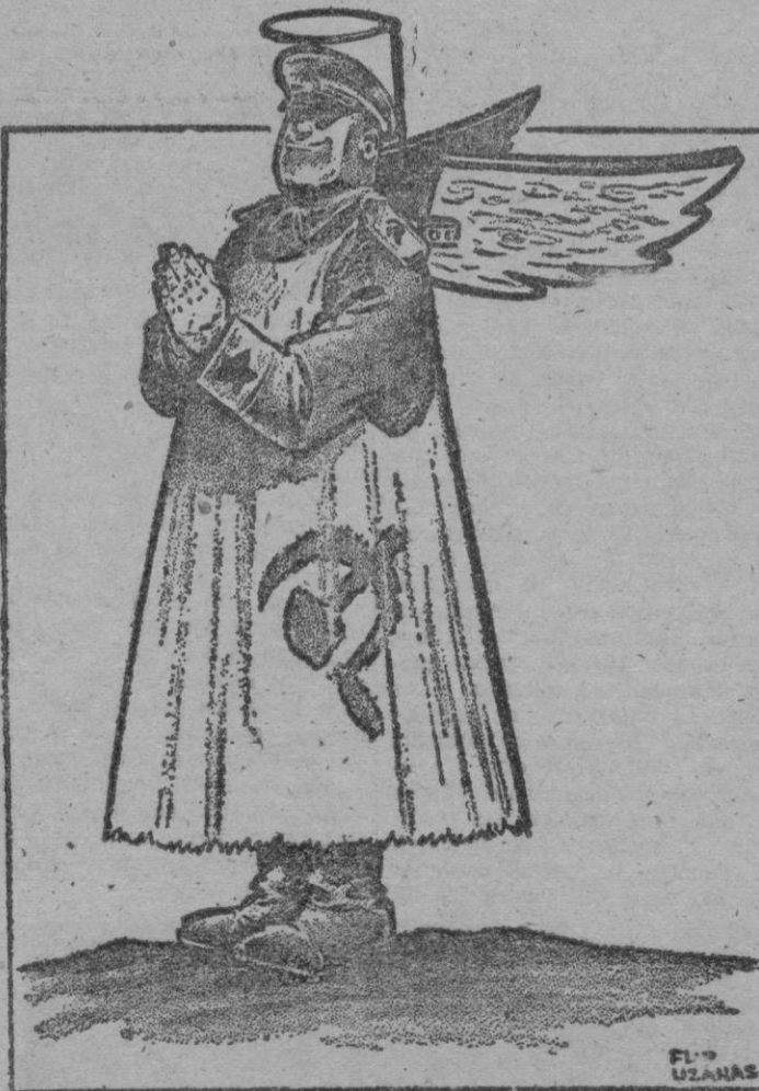
Dibujo de Philip Uznas publicado en el Hartford Courant, de Hartford, Connecticut (U. S. A.)