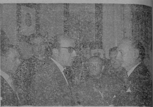
El Ministro Secretario General del Movimiento, camarada Arce, el pésame a don Miguel Moscardó Guzmán, hijo mayor del defensor del Alcázar.