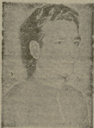
GABRIEL COMPANY va entrando en «forma»