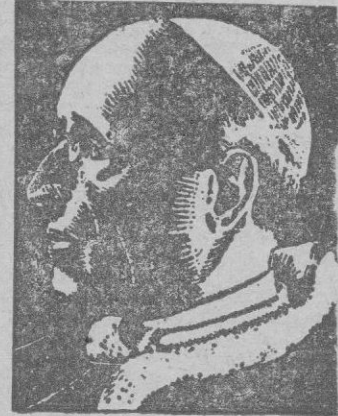
PIO XII el «primer europeo»

Se trata de Europa, de esta Europa, maltrecha y partida en dos, de la postguerra. Pero, al fin, de Europa. De la Europa histórica, la unidad etnográfica y cultural de personalidad más definida en la Historia, nacida en brazos del Cristianismo, al que debe no solo su fisonomía continental, sino su influencia civilizadora expansiva. Por lo mismo, también tenemos derecho a opinar sobre el problema candente, desde el punto de vista cristiano.