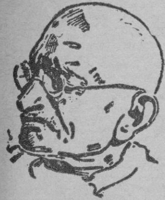
MAHATMA GANDHI «Gran Alma» de la India

Todos los días son buenos para aprender. Esto es lo que se llama hacer experiencia a costa de la edad, pero cuando este aprendizaje se nos mete por los oídos con noticias epatantes, peligra el sistema nervioso. Tal ocurre con la feliz idea que ha urdido el cerebro de miss Clara Boothe Luce, esposa del director de la gran revista «Life», antigua diputada republicana en el Congreso norteamericano, figura sensacional de la política y el periodismo de su país. Miss Boothe Luce ha hecho un viaje de conferencias por los Estados, con las cuales según dice un periodista, «scribió a América como nadie lo había hecho después de Sarah Bernhardt».