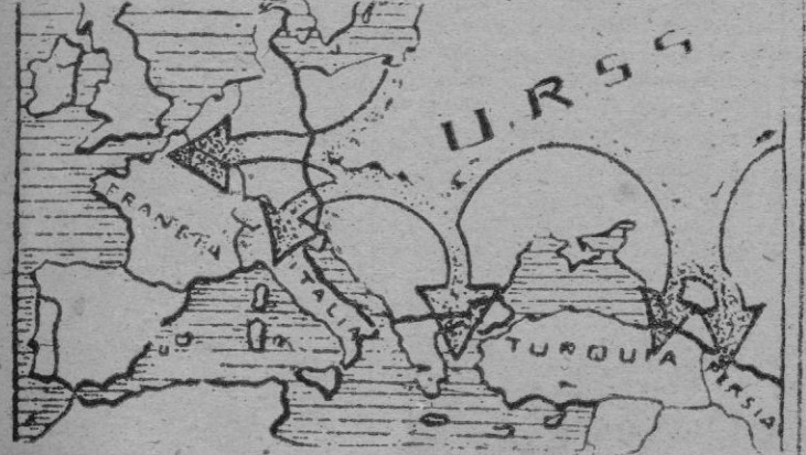
Las direcciones y objetivos posibles de una agresión soviética.