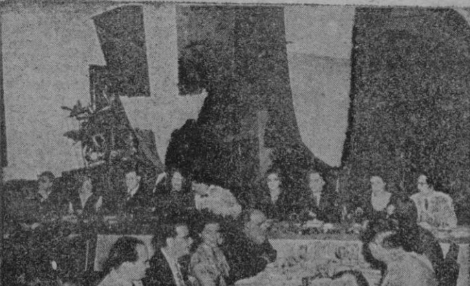
Ciudad Trujillo. — Un aspecto de la presidencia del banquete homenaje ofrecido por la colonia española de Ciudad Trujillo al Embajador español don Manuel Aznar.