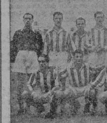
Equipo del Júpiter, que fué batido en «Son Canals», por 4-1

Empezó a dispartarse la marcha del partido con una expulsión prematura y sorprendente de uno de los mejores elementos jupiterianos, por motivo que juzgamos insuficiente, ya que en aquella jugada no pudimos apreciar pizca de malleca. Siguió lu-