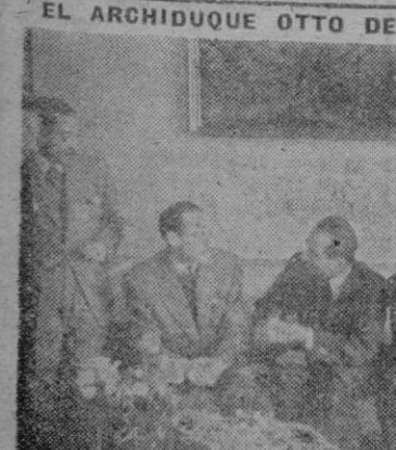
El archiduque de Austria, Otto de Habsburgo, rodeado de los informes de la prensa madrileña, a los que recibió en la mansión donde se hospeda.