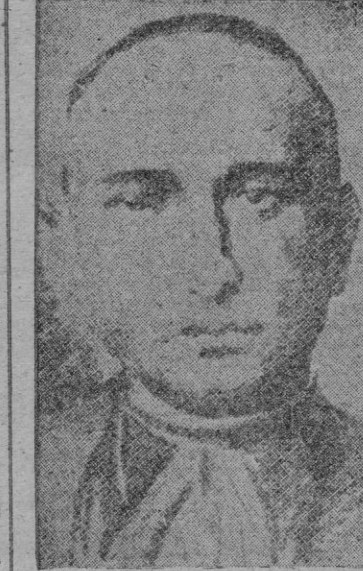
El Cardenal Mindszenty representa a la verdadera fuerza

Por Gaston de CLIGNANCOURT Reportaje especial para BALEARES