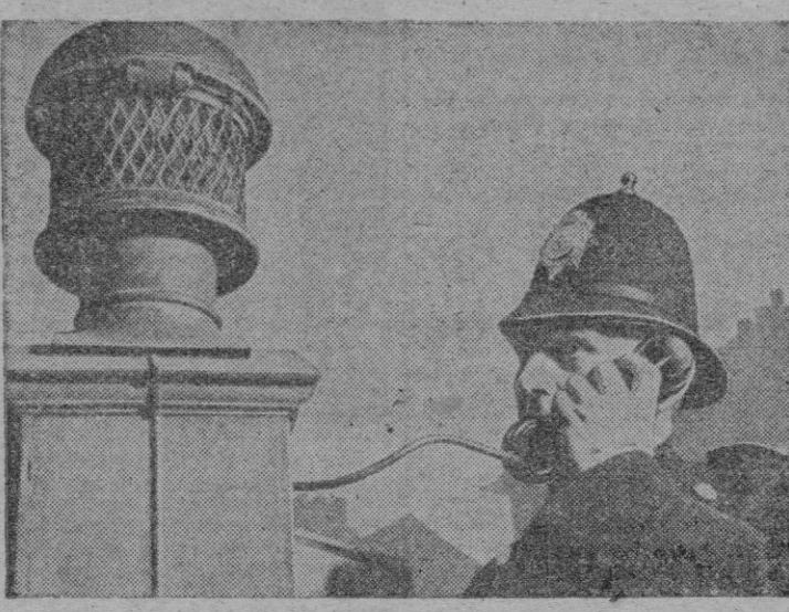
Llamada a «Scotland-Yard»... La inconfundible silueta del «policemen» londinense, tan familiar a los innumerables lectores de las novelas de Simenon...

Ni Dumas padre, ni Balzac, ni siquiera el creador de Rocambo. Je, aquel fantástico señor Ponson du Terrail, han escrito tantas cuartillas como Georges Simenon, el padre del inspector Maigret, el hombre que ha ganado millones con sus relatos, con sus novelas y con sus reportajes. Durante años ha escrito una novela al mes—a veces a la semana—y aun ahora, cuando en el análisis psicológico de sus personajes, continúa produciendo historias policíacas al ritmo de siempre. Simenon es el típico fabricante de literatura que cada siglo produce invariablemente.