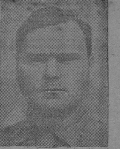
Joseph Kramer, oficial alemán que mandaba el tristemente célebre campo de concentración alemán de Belzen.