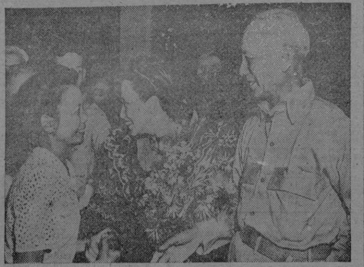
Sergio Osameña, Presidente de las Filipinas y su esposa reciben las felicitaciones en una recepción oficial celebrada en Manila.