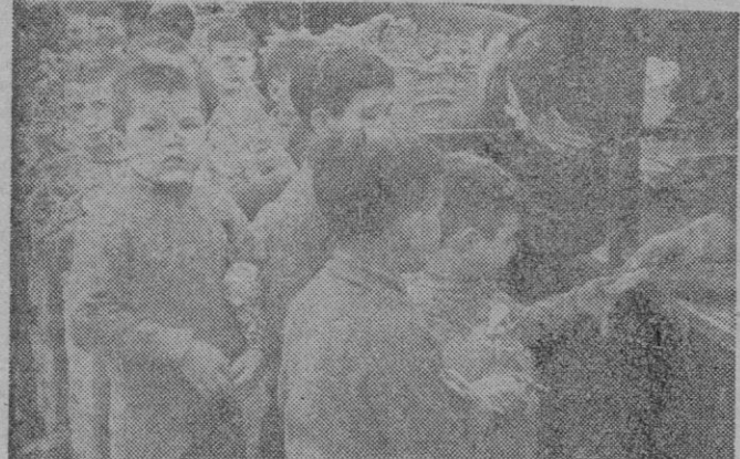
Con su grato cargamento de golosinas, los pequeños desfilan ante el puesto donde se les ofrece el «rico bombón helado»