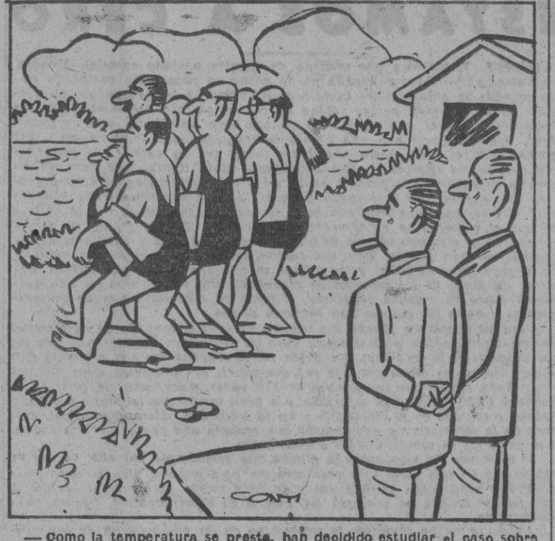
—Como la temperatura se presta, han decidido estudiar el caso sobre el terreno.