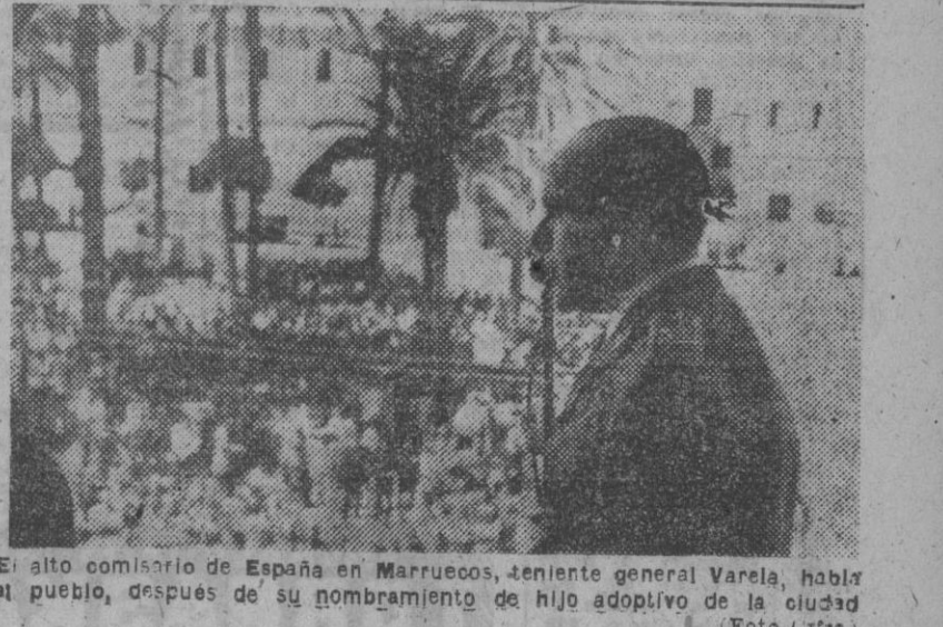
El alto comisario de España en Marruecos, teniente general Varela, habla al pueblo, después de su nombramiento de hijo adoptivo de la ciudad.