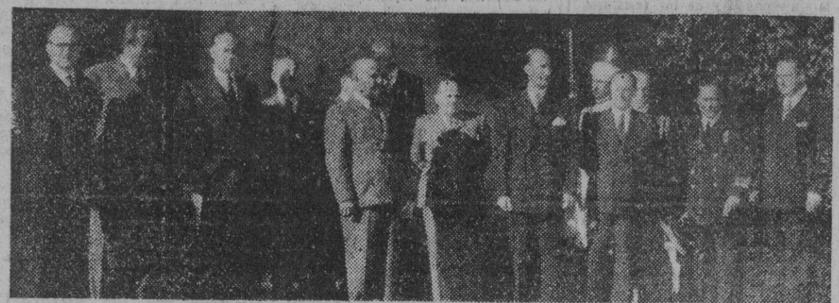
S. E. y Jefe del Estado, con los ministros del Gobierno, momentos antes del Consejo que se celebró en la residencia veraniega del Caudillo.