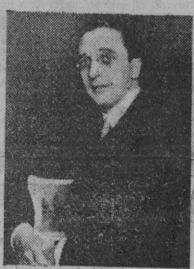
El ministro plenipotenciario, don Carlos de Miranda y Quartín, conde de Casa Real, que ha sido nombrado subsecretario de Asuntos Exteriores.