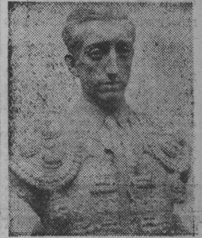
Un magnífico busto del diestro "Manolete", obra del escultor Vicente Navarro, con destino a la Plaza Monumental de Barcelona.

LA HAYA, 25. — Las raciones de pan, leche y queso para la población serán reducidas la semana próxima en Holanda, como consecuencia de la situación alimenticia internacional y de la sequía experimentada durante el verano, según se anuncia oficialmente. El pan se reducirá de 2.200 gramos a 1.800 cada cinco días; la leche, de dos litros a uno y tres cuartos, también quincenalmente, y el queso, de 100 gramos a 30. — Efe.