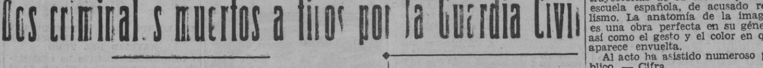
Los criminalistas muertos a tiros por la Guardia Civil.