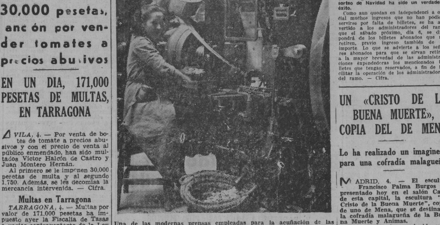
Una de las modernas prensas empleadas para la acuñación de las nuevas monedas de aluminio.