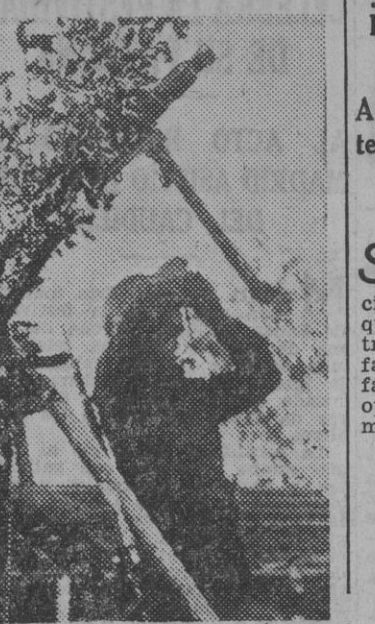
El observador otea el firmamento para descubrir el avión enemigo que intenta pasar la línea de antiaéreos.