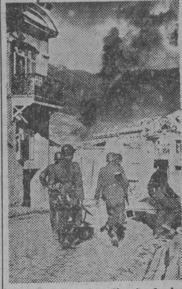
Soldados alemanes limpiando los últimos nidos de rojos en Jalta

TOKIO 4. — Grandes formaciones de bombarderos de la aviación japonesa han atacado fuertemente el aeródromo de Ankar en la provincia de Shensi, según se informa oficialmente. Los aviones japoneses regresaron a sus bases después de terminada la operación. — Efe.