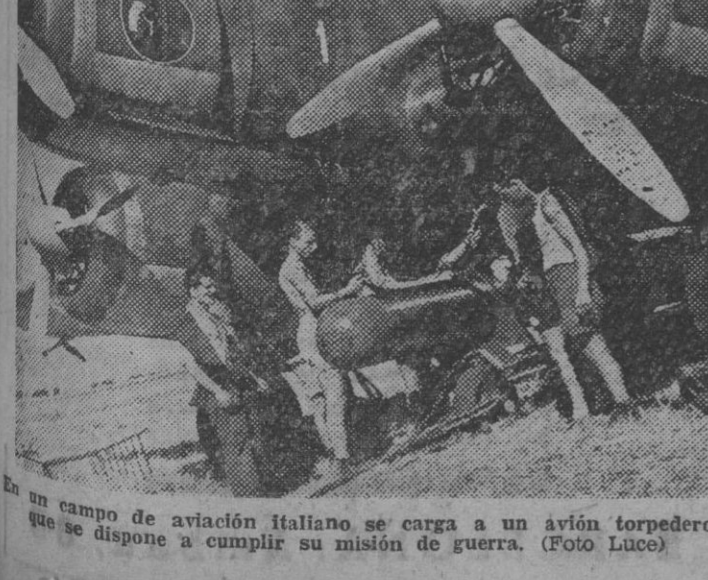
Un campo de aviación italiano se carga a un avión torpedero que se dispone a cumplir su misión de guerra.

SOLO HA RECIBIDO EL JAPON EL 50 POR 100 PETROLEO CONCERTADO