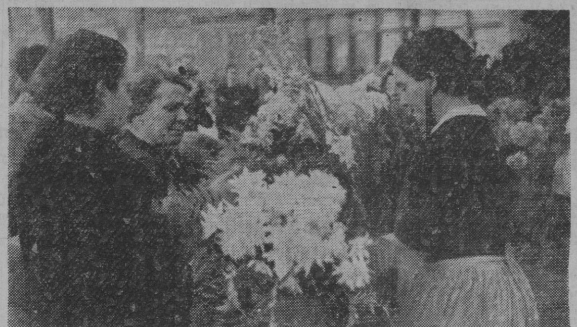
Los puestos de las Ramblas tienen estos días febril trabajo vendiendo crisantemos, flores de dolor para cubrir las tumbas de los seres que dejaron esta vida para buscar el descanso eterno de sus cuerpos y almas.

LA APEERTURA DEL PROCEDIMIENTO PUEDE VERIFICARSE EN CUALQUIER MOMENTO