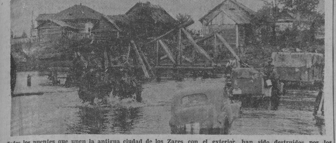
Todos los puentes que unen la antigua ciudad de los Zares con el exterior, han sido destruidos por los Soviets, a fin de contener el avance alemán, para quien no hay obstáculos.