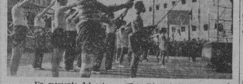
Un momento del acto.

En algunos momentos la lucha entre los diferentes equipos revistió de interés y entusiasmo. Han facilitado el vestuario los Clubes Español y Barcelona, Clubs que merecen nuestra felicitación sincera por la aportación simpática a tan humana fiesta.