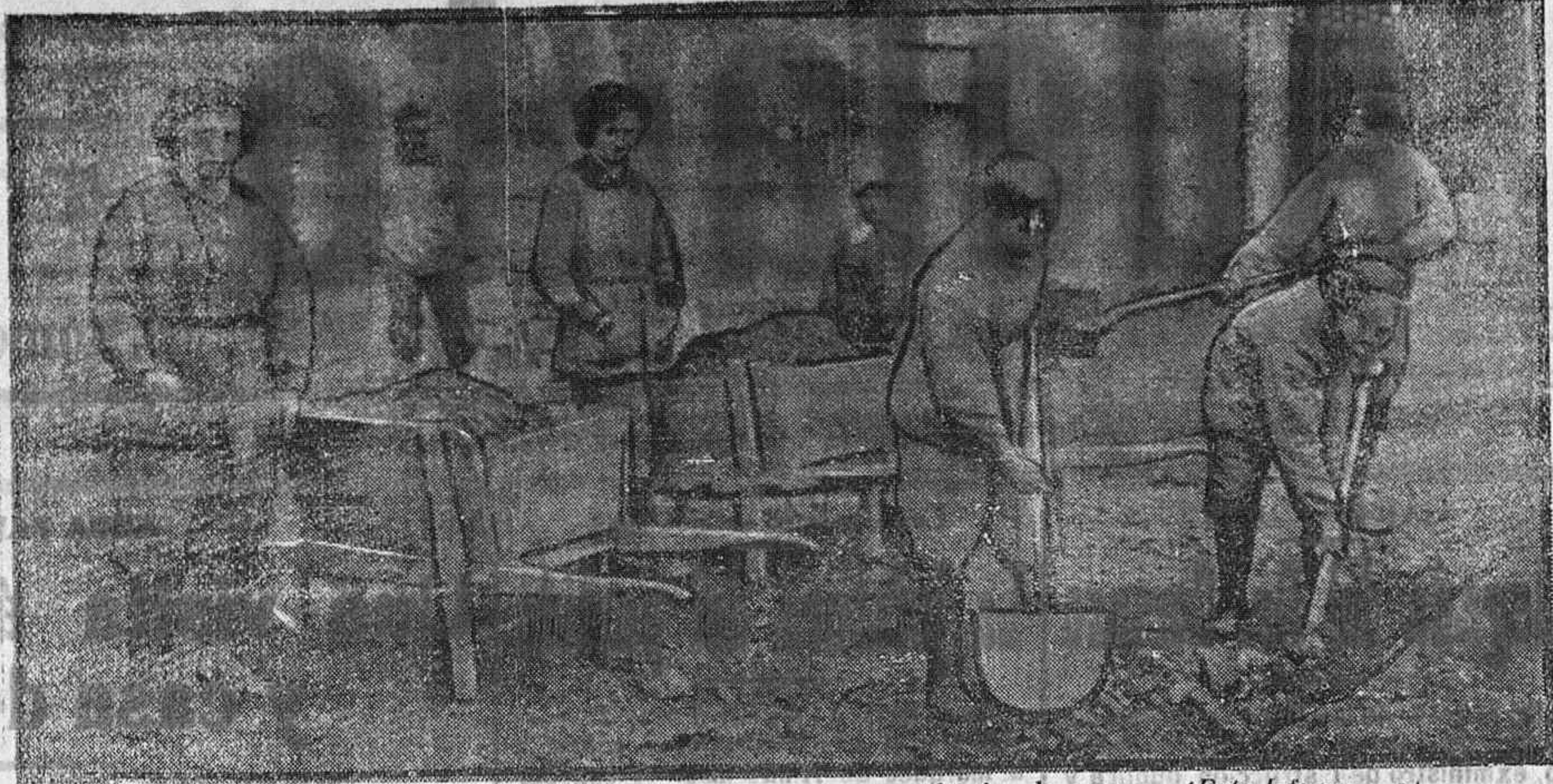
Trabajadores en una fábrica de guerra.