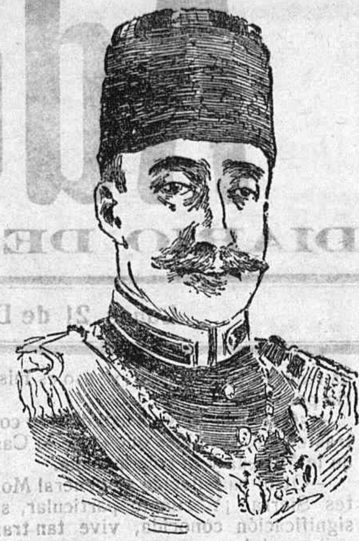
El príncipe heredero de Turquía Buffuf Izzedi Effendi, que figura á la cabeza de los turcos contrarios á la guerra.

Secciones á las seis y media y nueve de la noche.