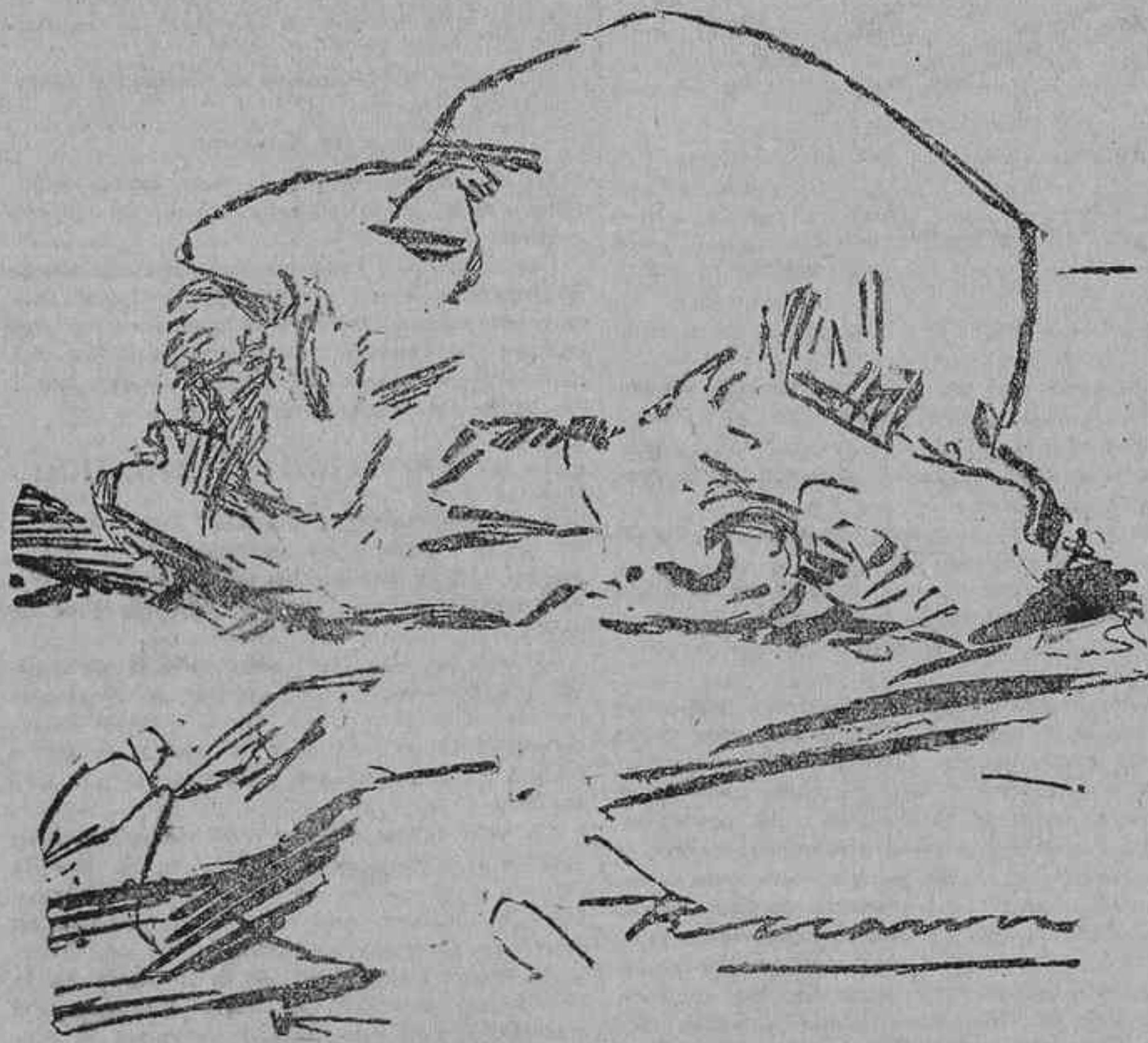
APUNTE DEL NATURAL EN LA CASA DE SOCORRO