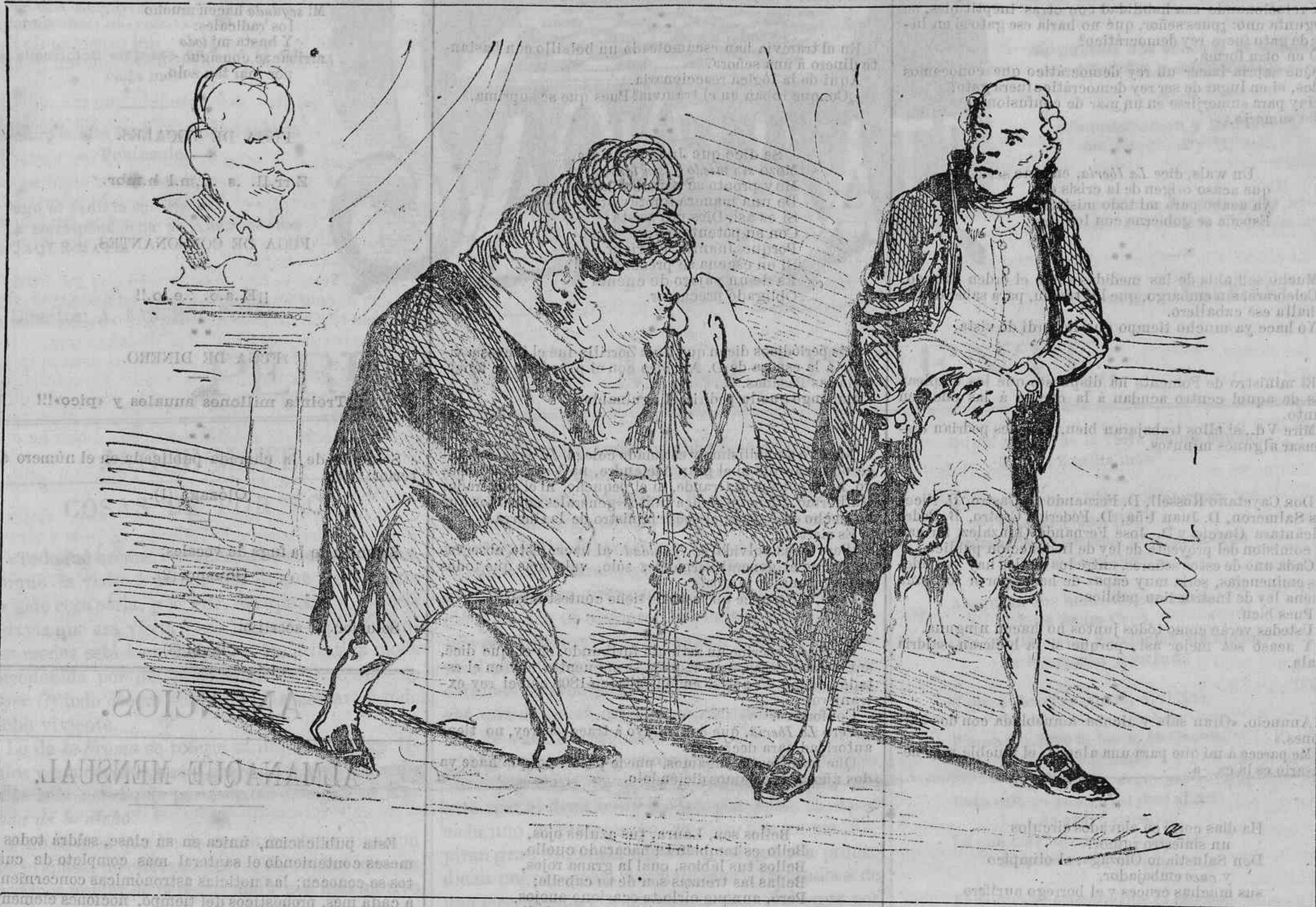
Nuestro embajador en París se despide provisionalmente de su inseparable borrego; ¡quién sabe si volverá!