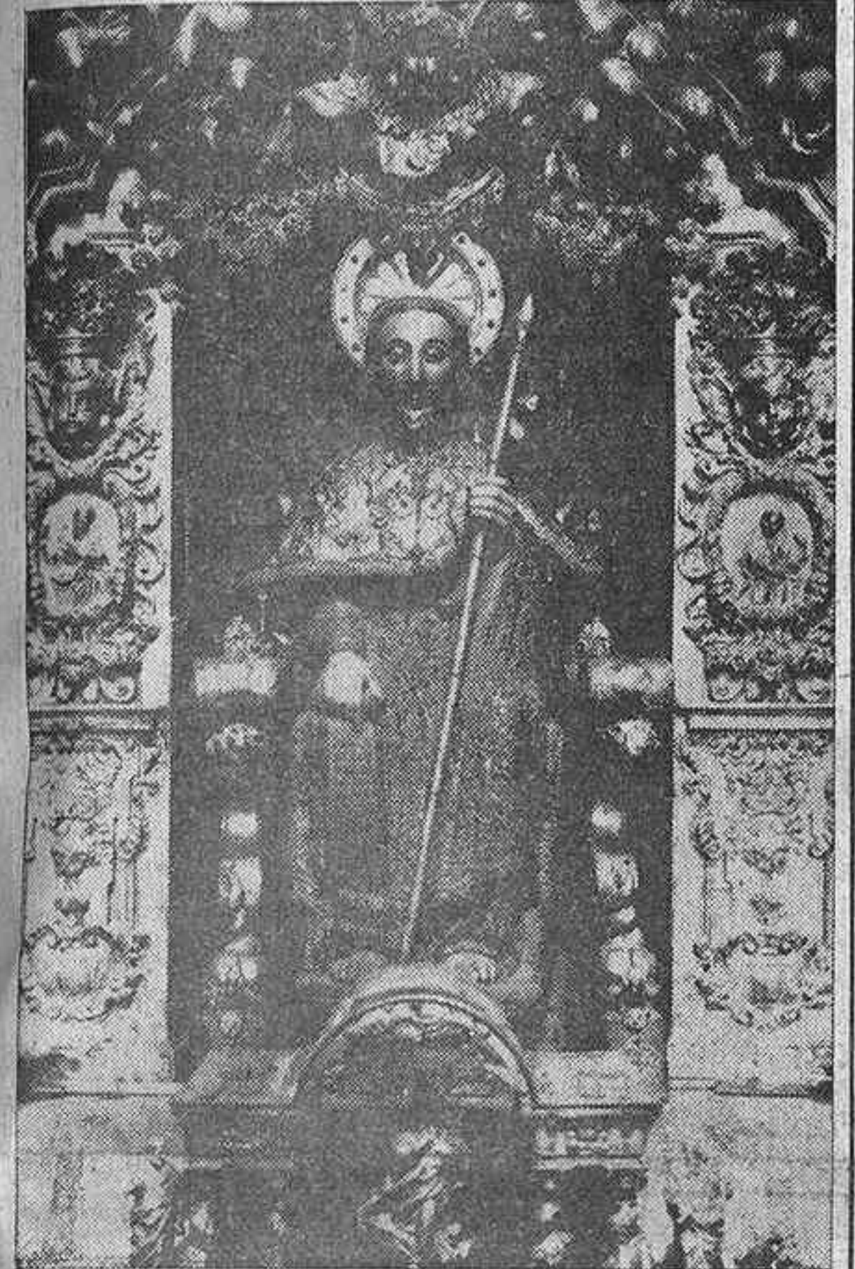
He aquí la imagen del glorioso Patrón de las Españas, Santiago Apóstol, que se venera en la catedral de Compostela.

La imagen del Santo Apóstol recorrerá esta tarde, a las ocho y media, las calles de Madrid