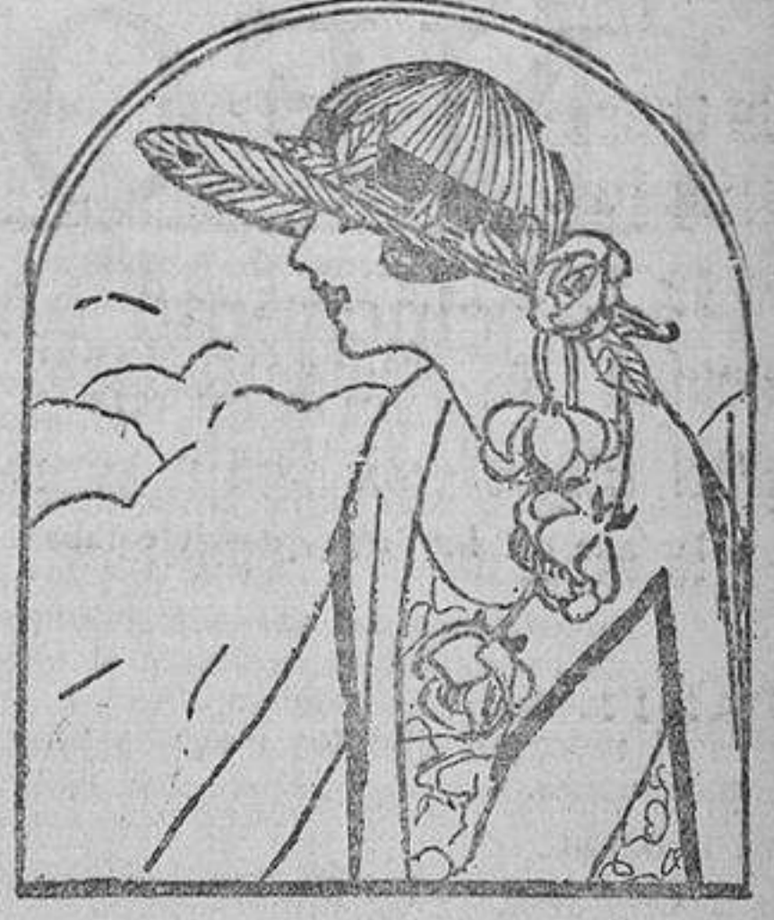
Sombrero de seda azul marino, guarnecido con una cinta de terciopelo de tono más oscuro alrededor de la copa. Además, lleva una caída de rosas artificiales.

LA REVISTA MENSUAL “ELEGANCIAS,” Editada por Prensa Gráfica es el periódico preferido por la mujer Precio del ejemplar en toda España TRES PESETAS