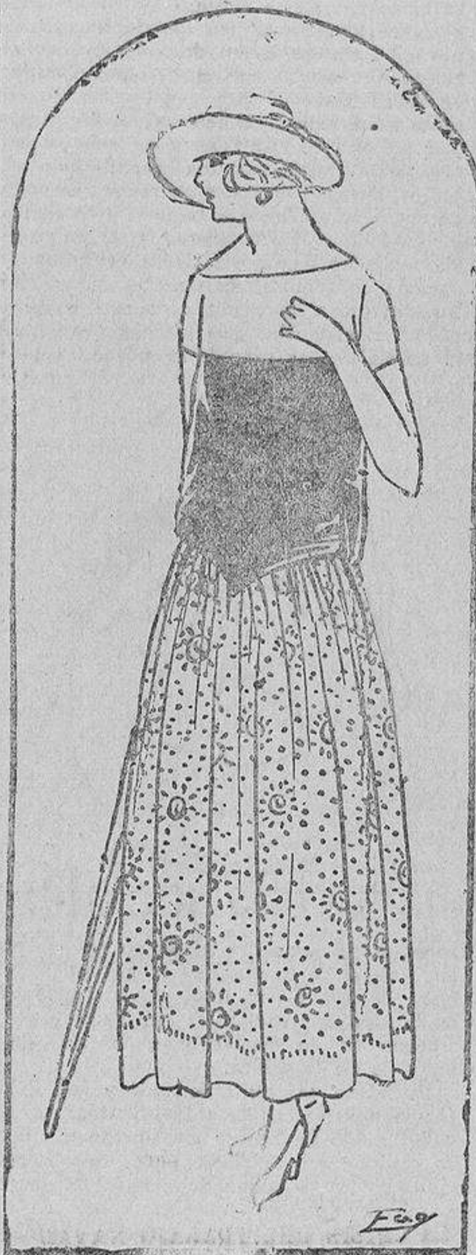
Vestido compuesto de tres piezas. El canesú es de crespón blanco, el corpiño de seda negra y la falda de organdí, bordado en negro.

se sostuvo con lo que ganaba haciendo traducciones y reunió los medios para regresar.