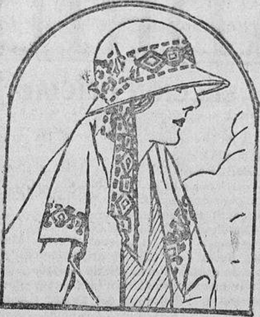
Sombrero de fieltro blanco, guarnecido con una cinta de seda estampada. A uno de los lados lleva una caída igual, que hace juego con los adornos de la chaqueta.