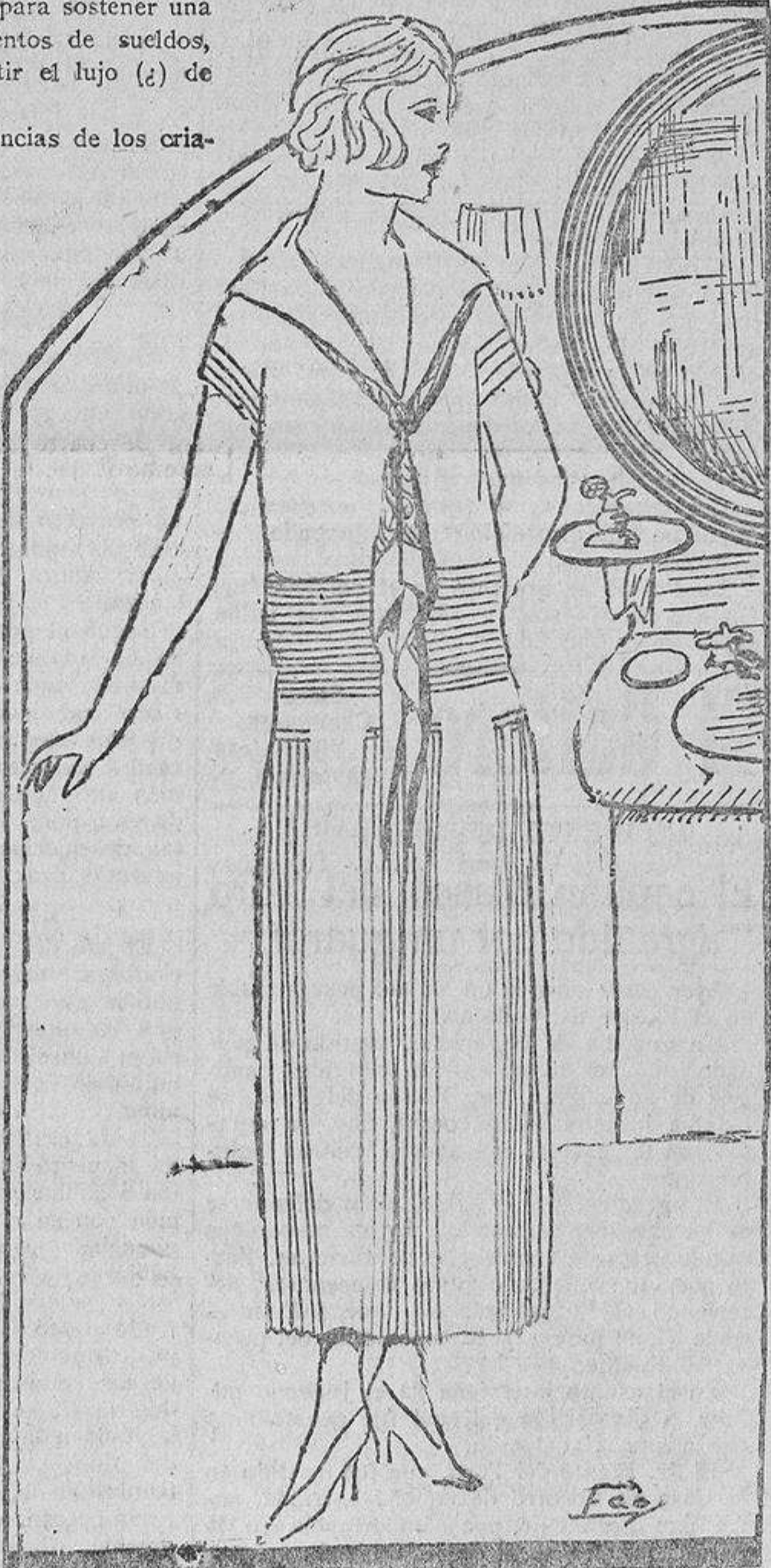
Sencillo traje de seda plisada en la cintura y falda. El escote se adorna con un trozo de seda estampada.