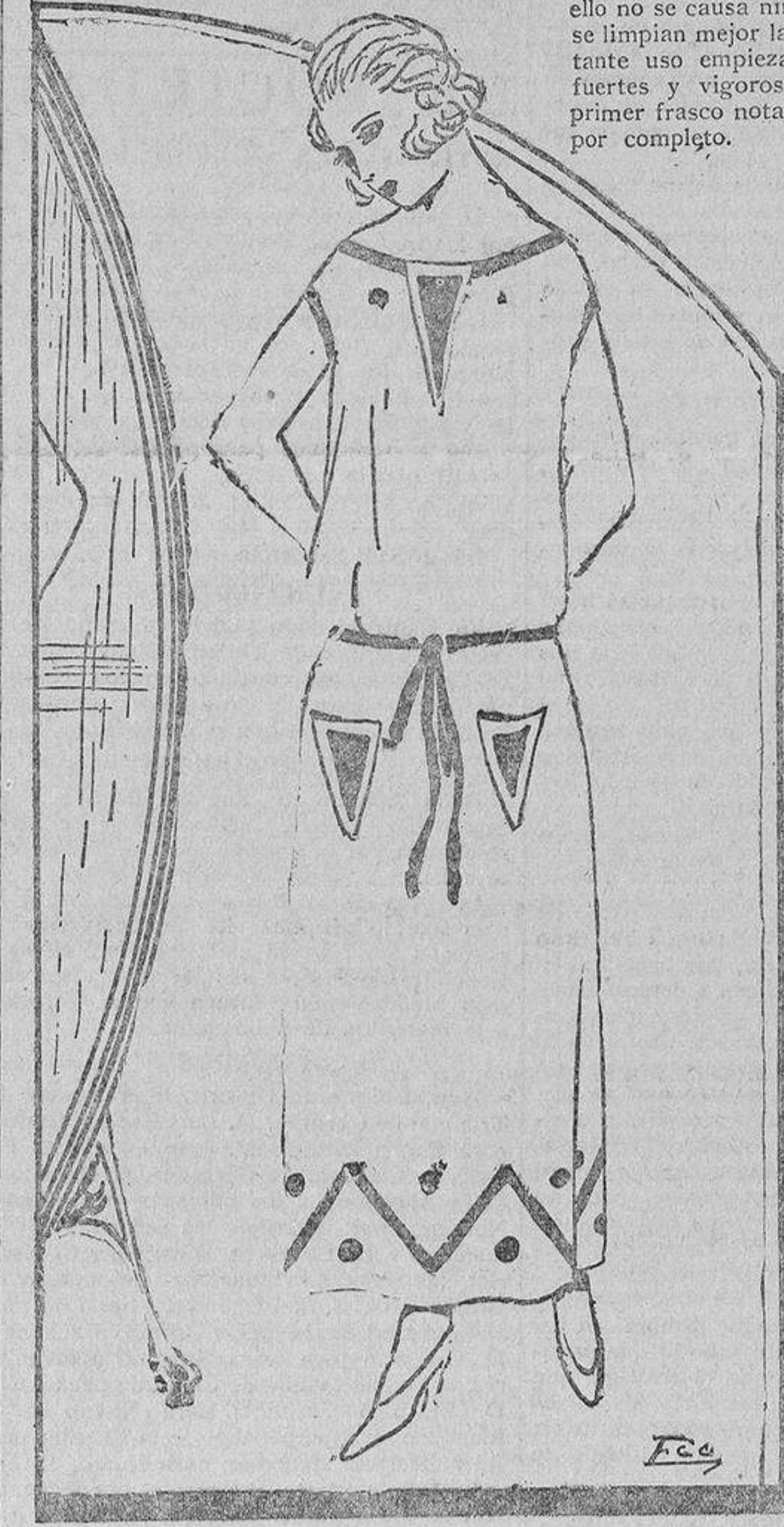
Vestido de crespón blanco, adornado con cinta y bordados en tono rojo. El escote y los bolsillos también se adornan con rojo.