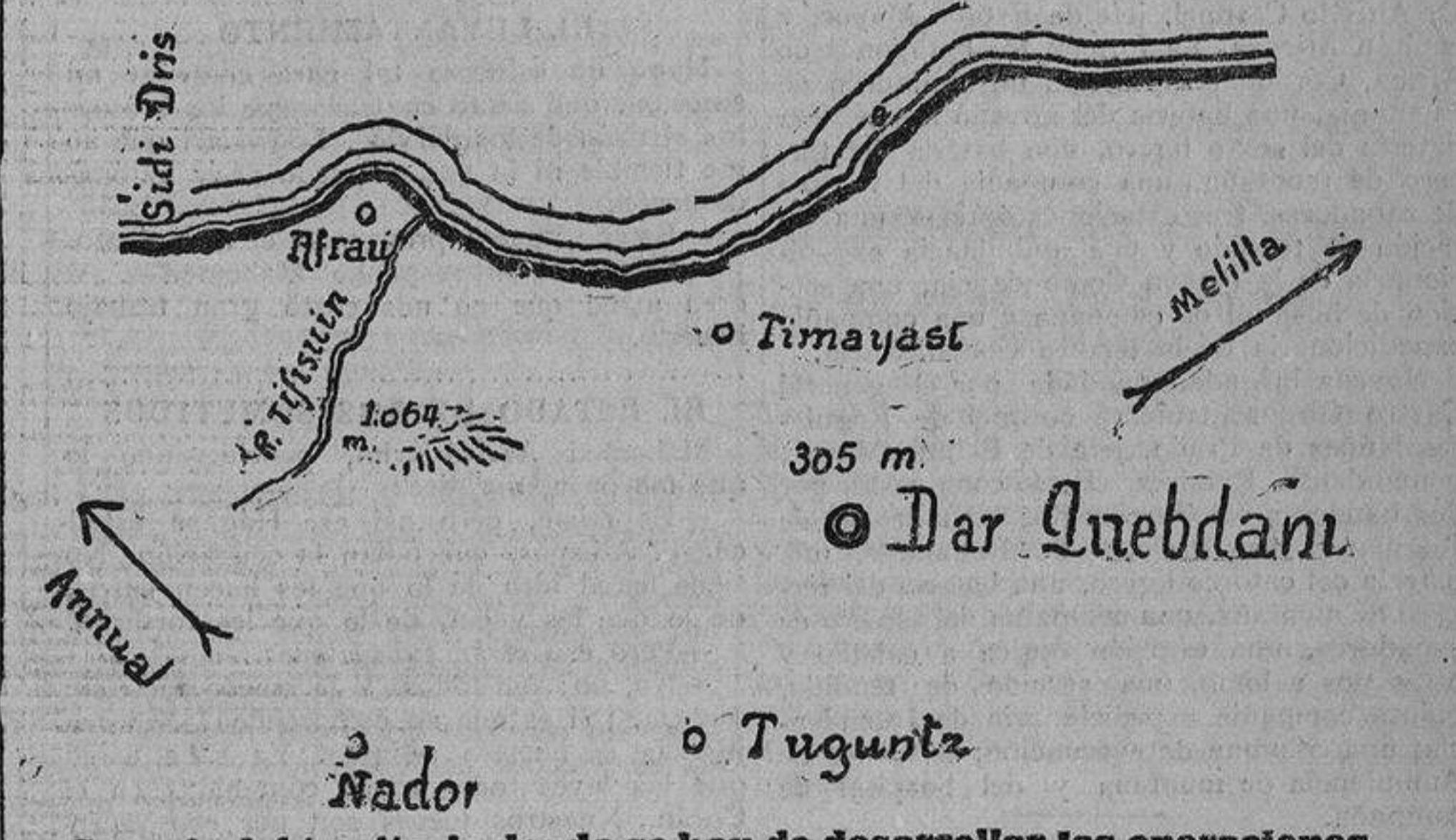
Croquis del territorio donde se han de desarrollar las operaciones

El alto comisario prepara un movimiento, que se inicia con una demostración de la escuadra, bombardeo de poblados y movimiento de columnas.—Los prisioneros serán rescatados de grado o por fuerza.