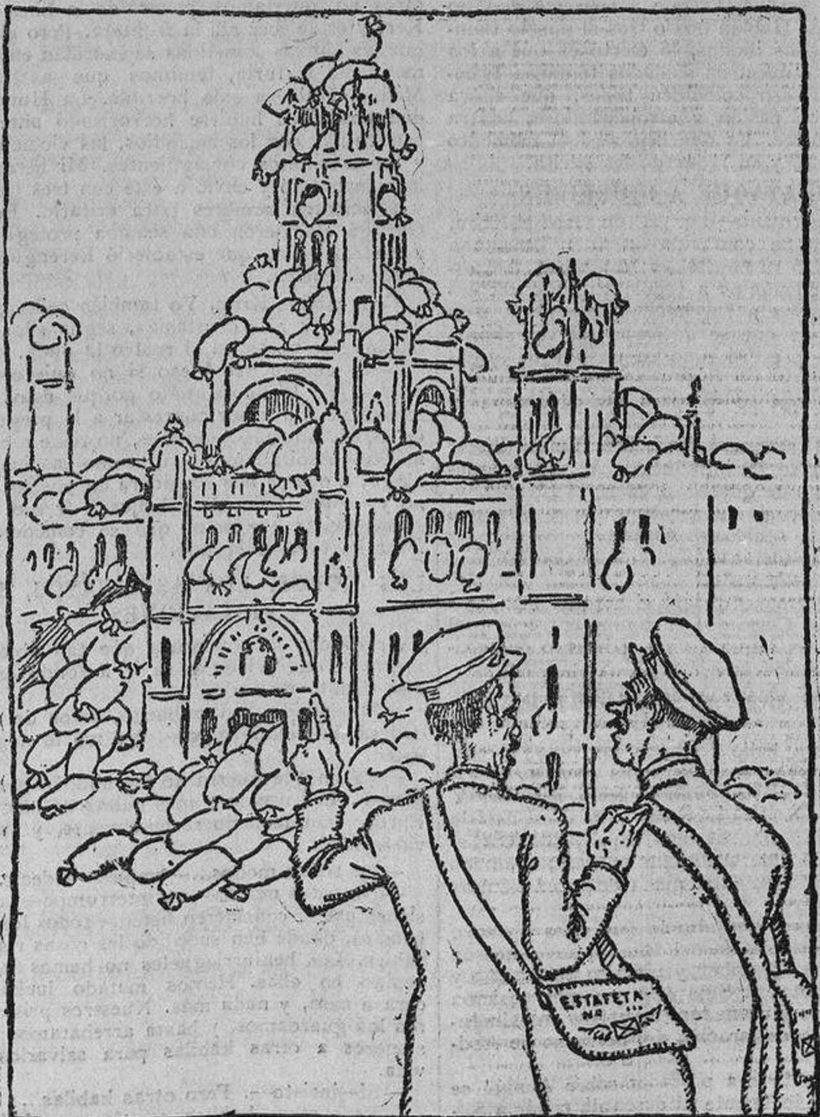
UN CARTERO.—Y después de todo, este conflicto ¿qué? EL OTRO.—¡Mira qué sacas!

Un poco caro ha encontrado Japón el precio. Prosiguen las negociaciones. Esperemos, para la dicha futura de Suan-T'ong, que se llegará a un acuerdo.