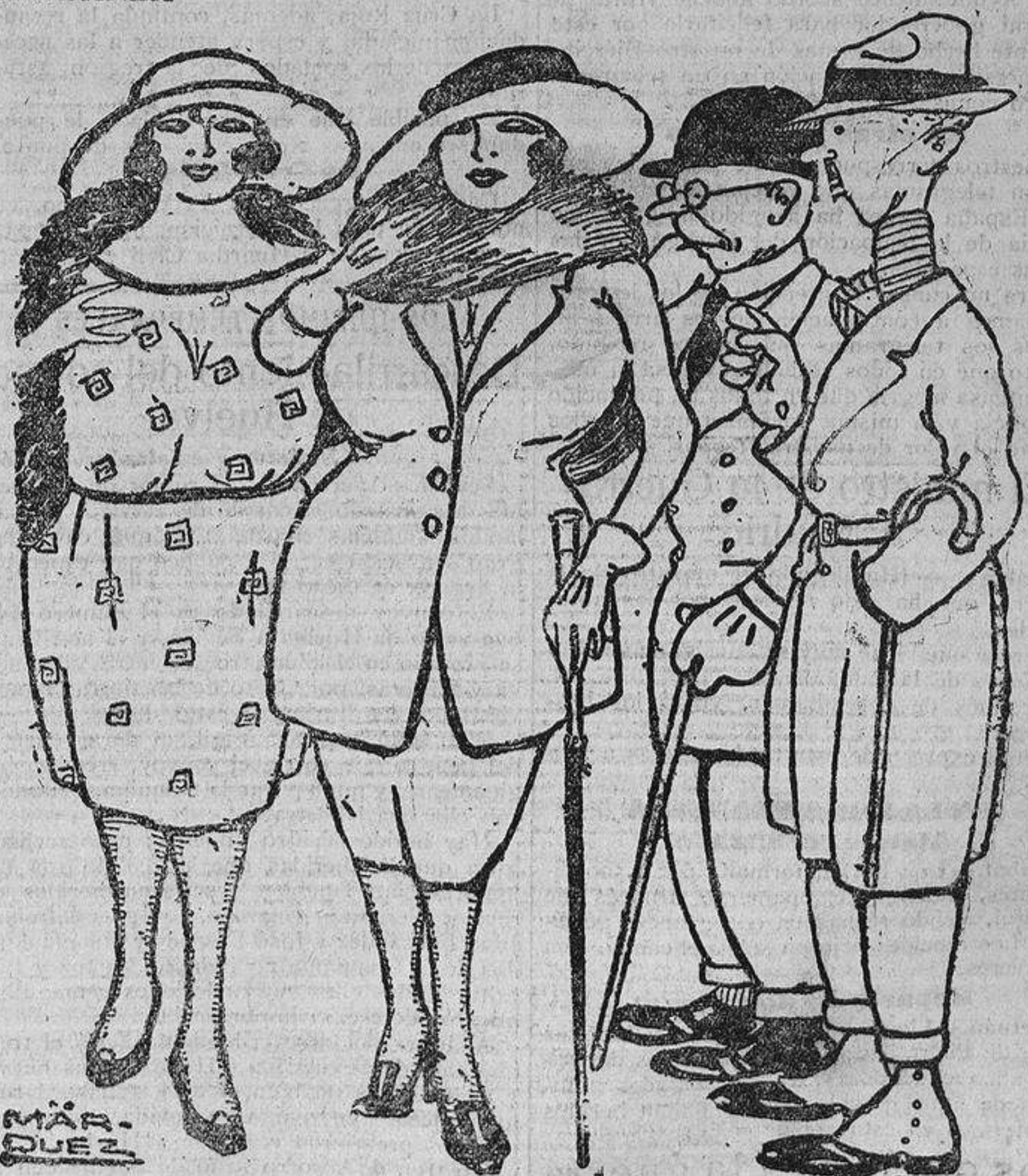
—Mira qué estupendas van las de Gutiérrez. —¿Las de Gutiérrez? ¡Creí que eran las de Nador!