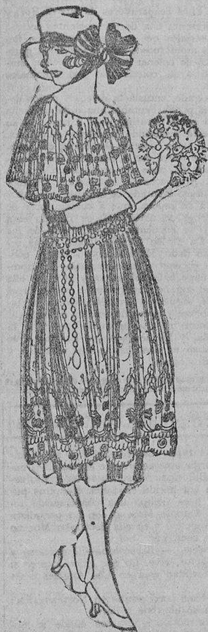
Un vestido de encaje de algodón o tul bordado, color crudo, con doble fila de cuentas verde malva.

Las pomadas y materias grasientas son perjudiciales, ya que aumentan el carácter grasiento de esta secreción.