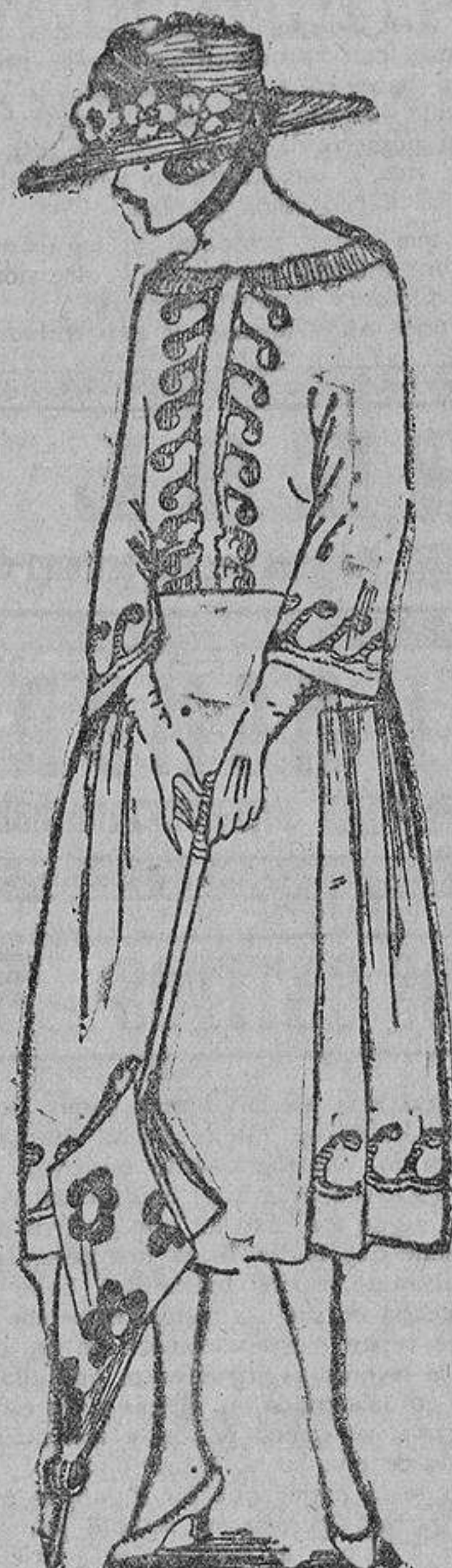
Unos bordados rojos de algodón grueso lavable sobre un vestido de algodón crudo y una hilera de botones rojos de galalla.

Deben usarse lociones alcoholizadas, como la siguiente: