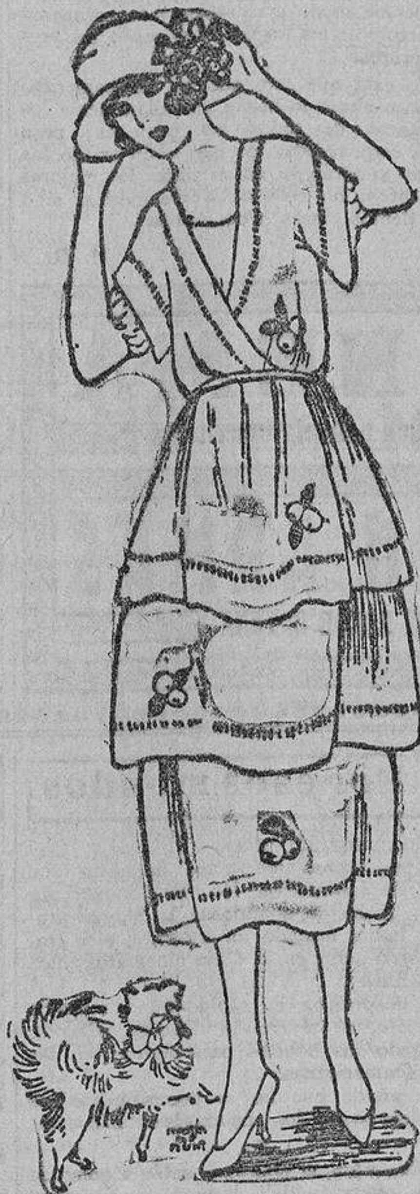
Una nota sencilla es este vestido de «tussor» blanco con tiras de tussor color limón en el borde, naldas con calado y unas frutas recortadas de gamuzá.