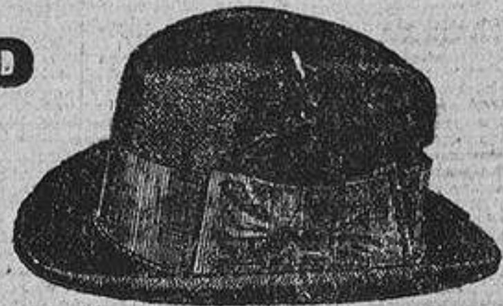
Sombreros flexibles, de fieltro, gran novedad, clase fina, surtido en colores. a ptas. 7,50. Los mismos, en clase superior y extra, a ptas. 11 y 15.