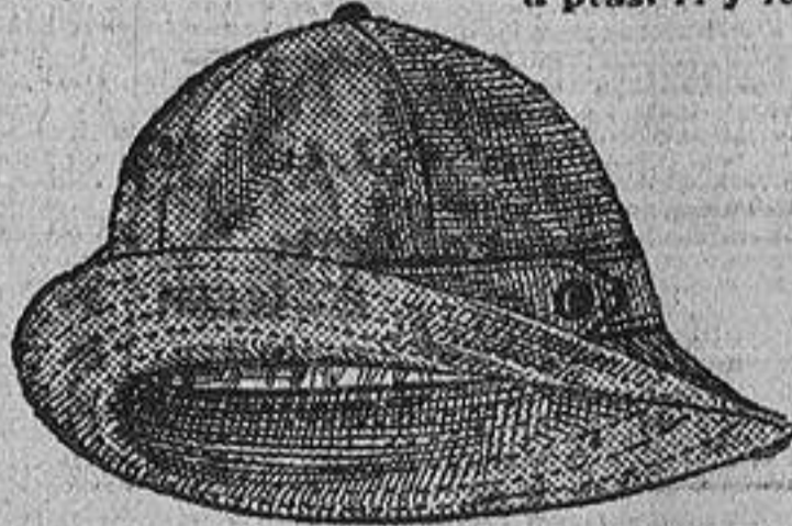
Sombreros impermeables, para niños, color beige, a ptas. 4.