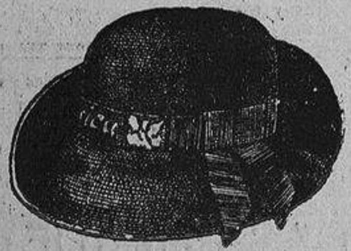
Sombreritos de fieltro, para niños, varios modelos, surtido en colores, a ptas. 6,50.