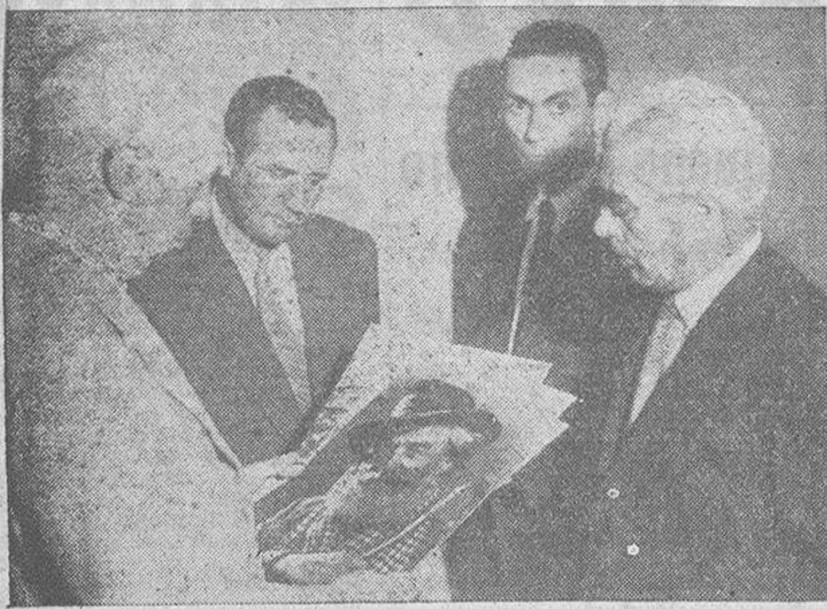
El presidente de la Sociedad Fotográfica con los organizadores de la Bienal de La Coruña examinan varias de las obras recibidas. (Foto Blanco).