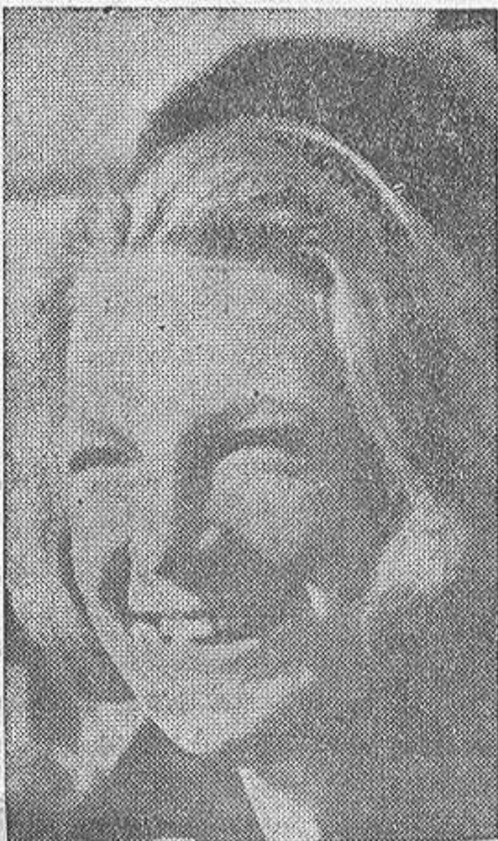
LA PRINCESA IRENE