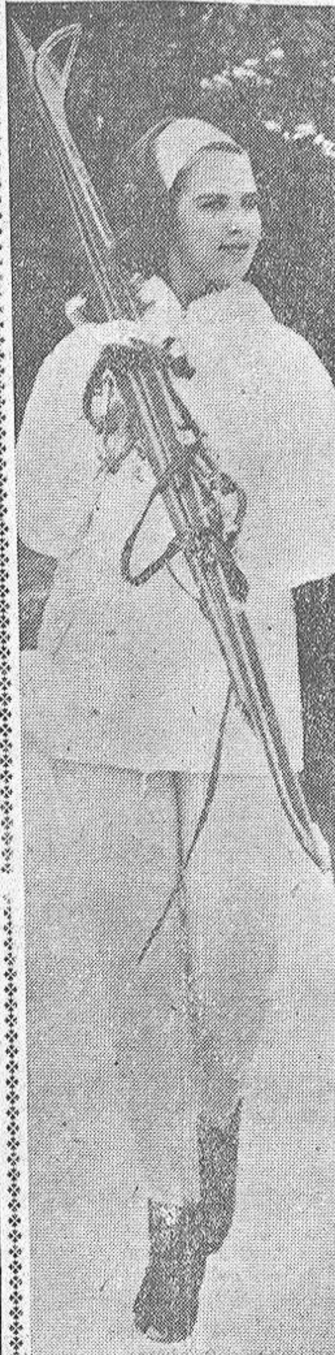
Aquí vemos a la Princesa Anna de Dinamarca, que se dispone a practicar el esquí en una de las pistas próximas al colegio suizo de Lenk, donde asiste a un curso de economía doméstica. La muchacha recibe una adecuada formación con vistas a sus futuras obligaciones. No olvidemos que la joven Princesa contraerá matrimonio con Constantino de Grecia, heredero del Trono de su país, y que la boda se celebrará el próximo año, cuando Anna cumpla dieciocho años