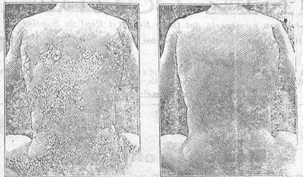
Antes de la curación Después de 15 días de tratamiento

Curación de las enfermedades de la piel y también de las llagas de las piernas LA PIEL Males de las piernas