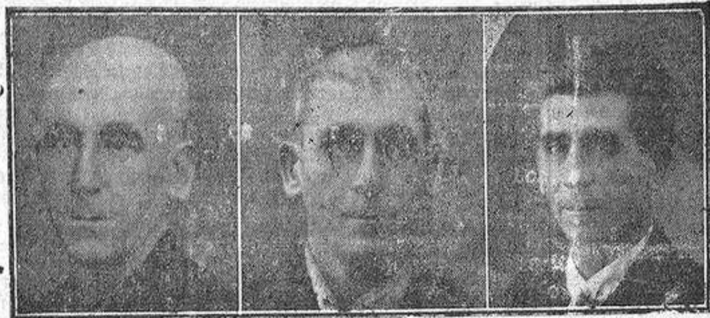
La misma persona antes y después

Revelación sensacional—El rejuvenecimiento de la fisonomía humana