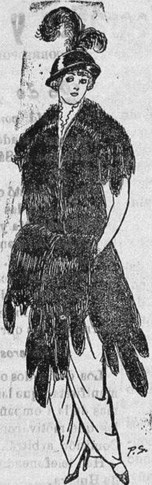
Juego de pieles imitación de Renard negro. De Ptas. 43 a 75