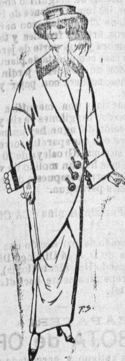
Abrigos de patén para señora De ptas. 5 a 65

Madrid, Barcelona, Almeria, Bilbao, Cádiz, Cartagena, Gijón, Granada, Málaga, Palma de Mallorca, Santander, Sevilla, Valencia, Valladolid y Zaragoza.