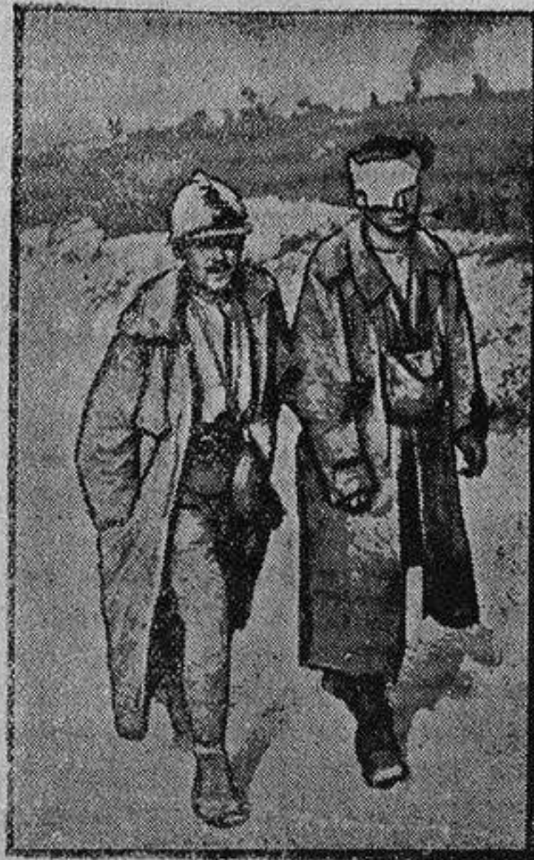
Soldado conduciendo a un camarada herido