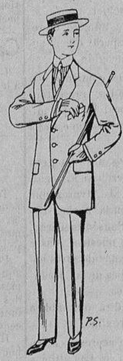
Trajes de lanilla, vi- cuña, etc., para niños de 10 a 16 años De ptas. 14 á 48