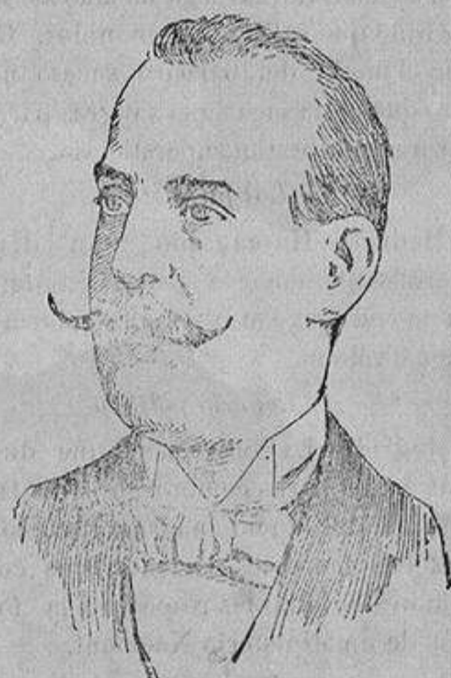
El rey Constantino de Grecia, cuya grave enfermedad hace temer un fatal desenlace