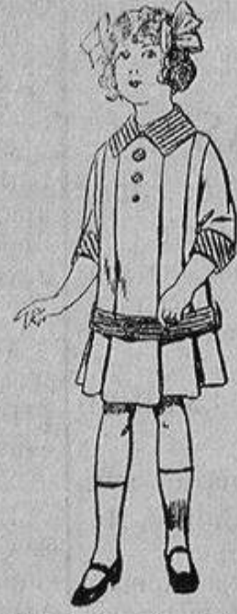
Vestidos de dril para niñas de 4 a 12 años De ptas. 5 a 12