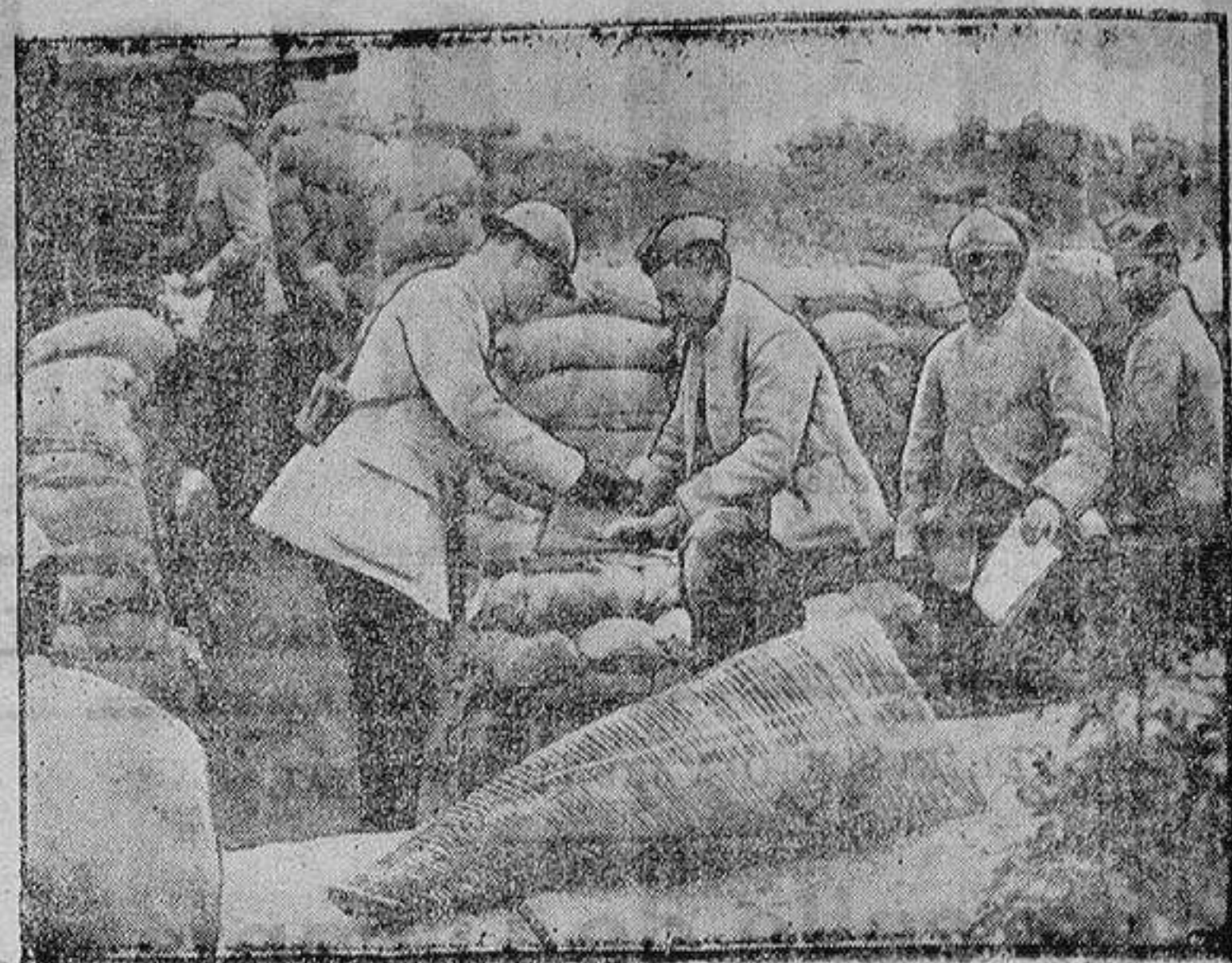
Reparto de tabaco en las trincheras

No tiene rival en España—Mezcla autorizada—De venta Panaderías, tiendas de Comestibles y confiterías. Representación en ésta: Calle de