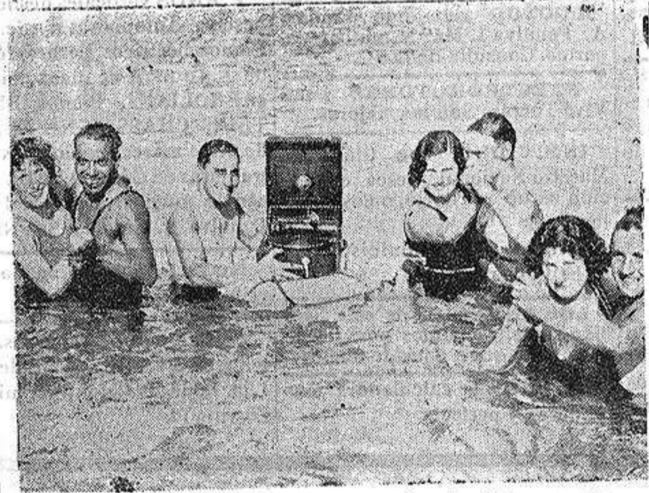
Escena de Playa.—El baile y el baño simultáneamente.

Dice que la amnistía no hay que pedirla como gracia, sino exigir la, por considerar que al otorgarla se reparará el atropello cometido con quienes sufren