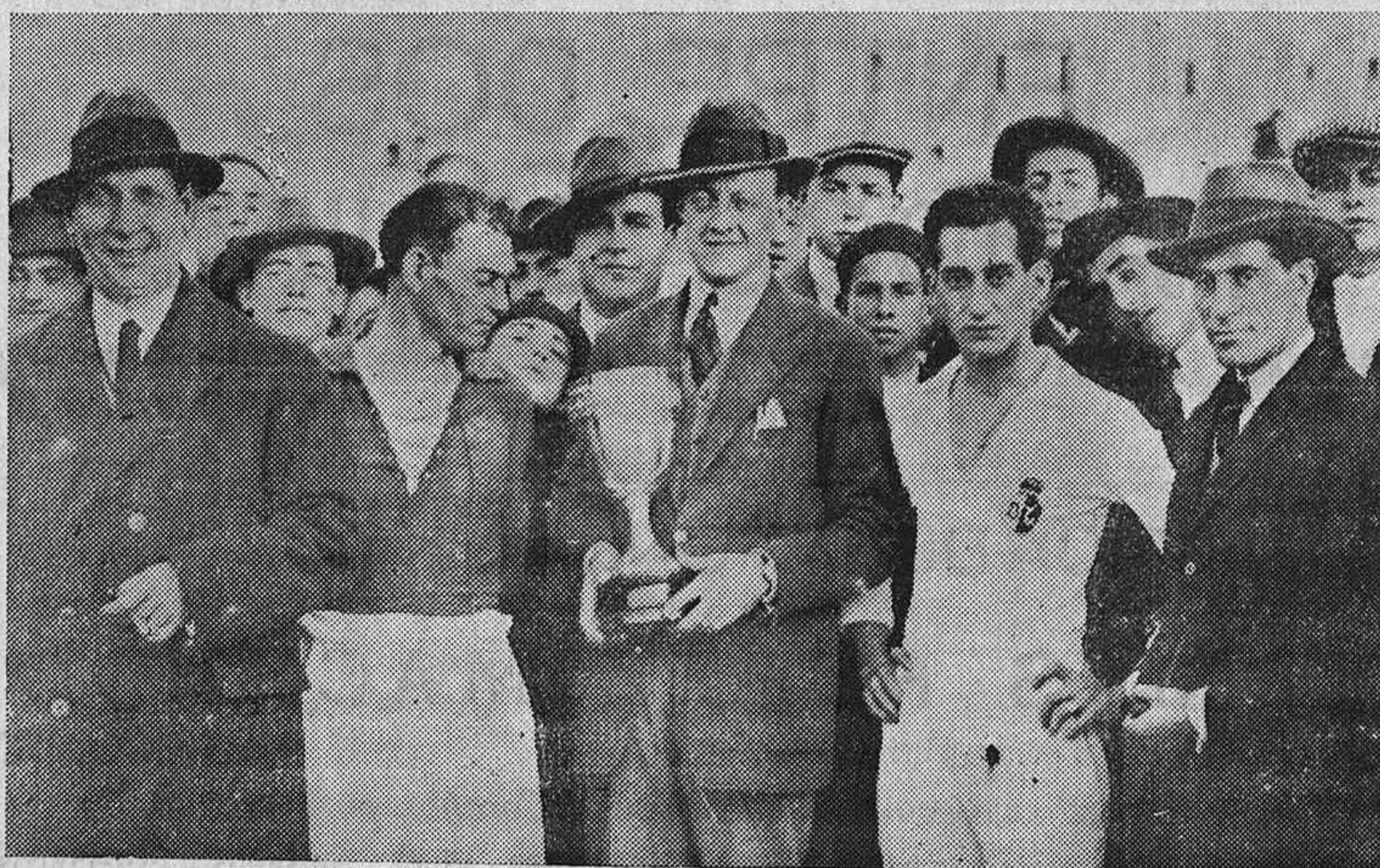
Los capitanes de ambos teams con los señores Becerra, R. de Castañeda y administrador de los excelentísimos señores Marqueses del Mérito, posan ante el objetivo del fotógrafo Adolfo de Torres, momentos antes del encuentro.—Barragán, inspirado , mira a la Copa, que después su team gana.

ANTES DEL ENCUENTRO BALOMPÉDICA-SPORTING