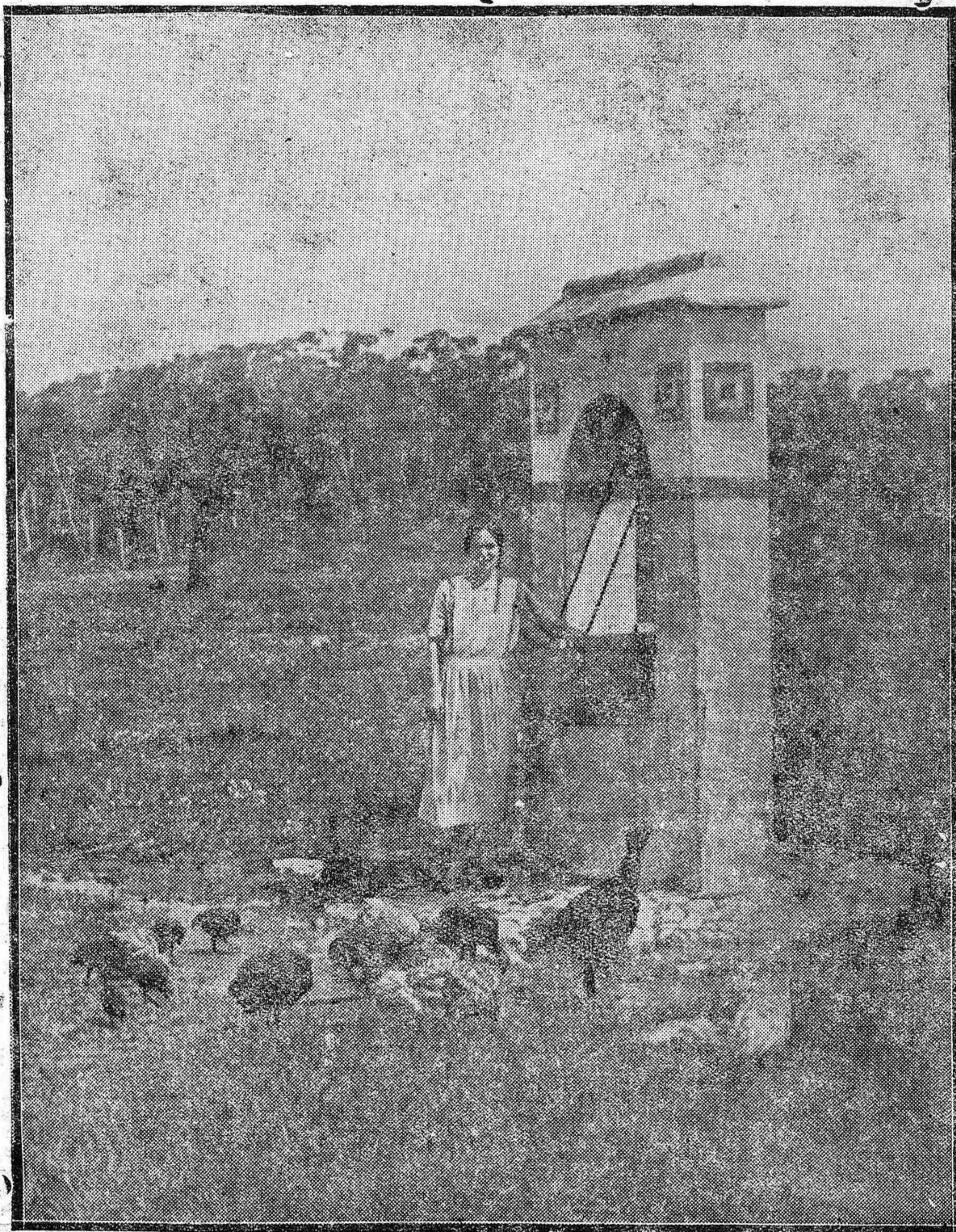
Paisaje del camino que conduce a Los Arenales y Villavieja