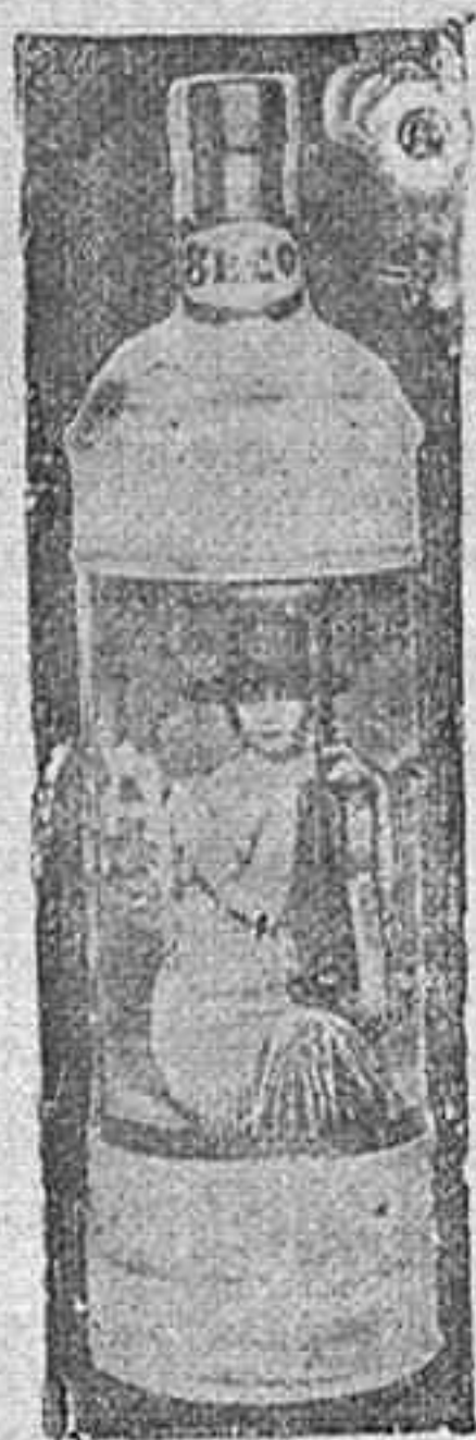
Anís La Cordobesa

EN GRANADA: Kiosco «La Prensa», Puerta Real.—Acera del Casino, 23.