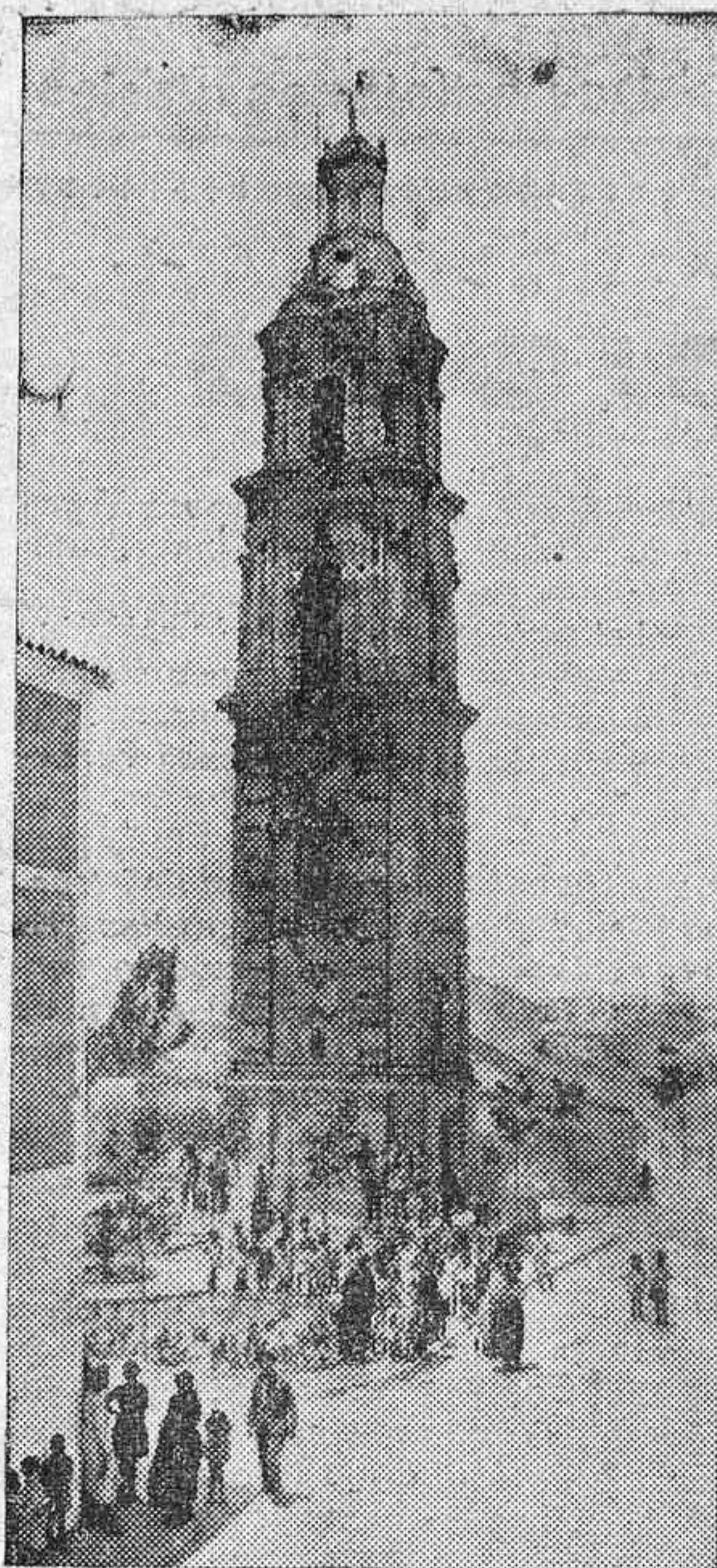
AGUILAR.—INTERESANTE «TORRE DEL RELOJ», QUE SE YERQUE EN EL SITIO MÁS ALTO DE LA CIUDAD.

Ha trasladado su clinica dental a la calle Braulio Laportilla, número 6 principal, esquina a Góngora.