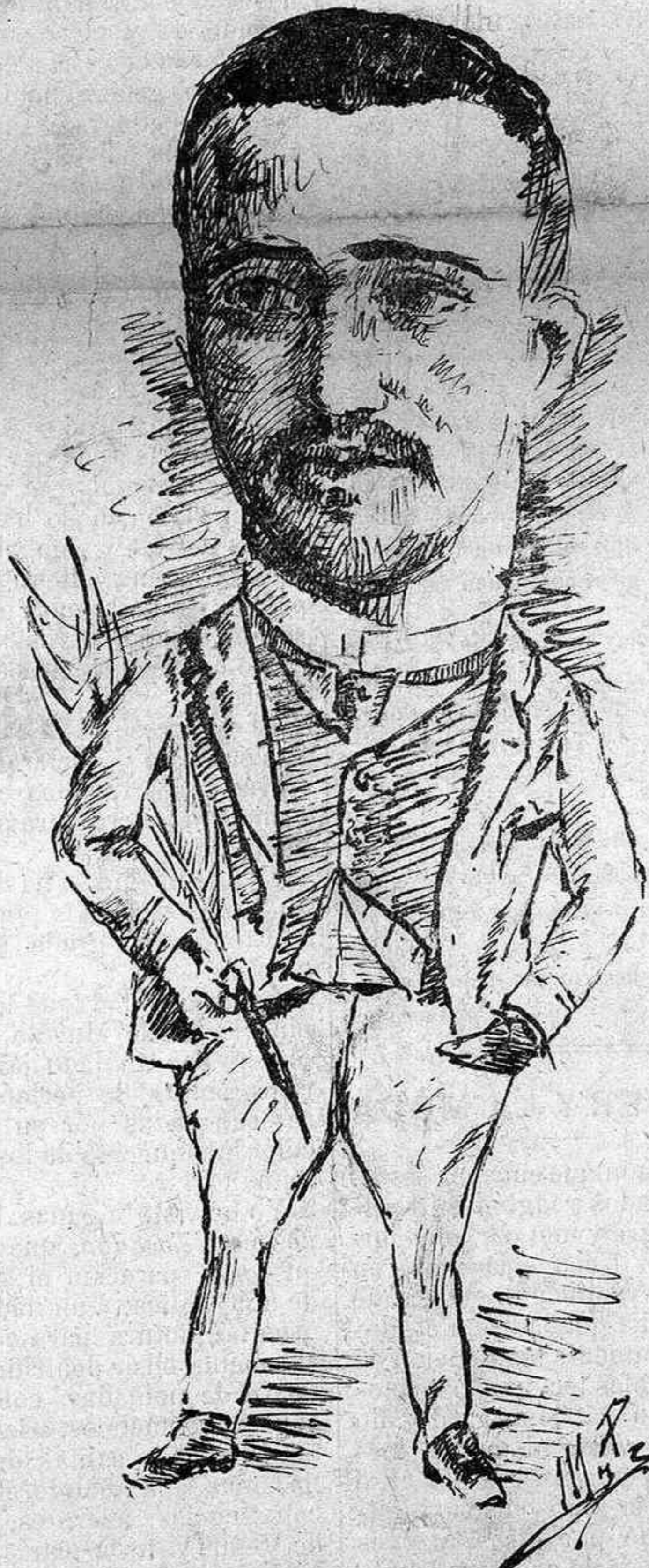
Redactor listo y amable, es un chico de salero; tiene además de notable el ser un recomendable revistero.

todo cantor; pues lo mismo endilga peteneras, malagueñas, jaleos. etc., como ópera italiana y hasta francesa, figuraos, repito, un pueblo de tales condiciones encerrado durante buena parte del año en ese húmedo calabozo llamado invierno con su desapacible y monótono chin..... chin..... acompañado de granizo, heladas, sabañones, etc., etc., salvo la lotería de Ceario el Corto que viene á ser como un oasis en medio del desierto, y por lo tanto un pueblo que espera con ansia la venida del dia que ha de alumbrar el sol de su libertad. Nada, pues, mas natural que un pueblo de estas condiciones se entregue de cuerpo y alma á sus inocentes diversiones en dias de felicidad.