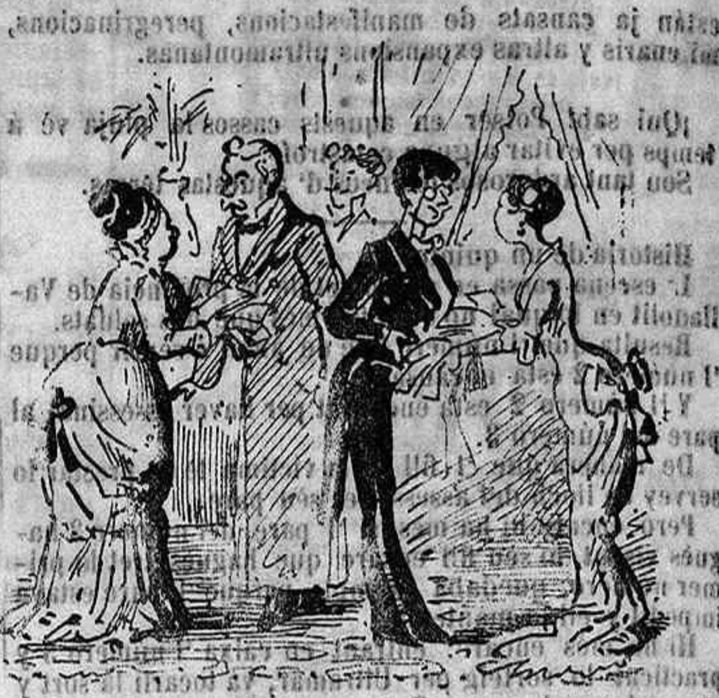
Senyoras qu' están aplicant las indulgencias.