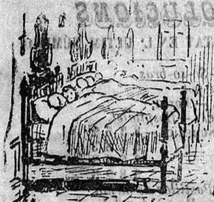
De 15 $ diaris.