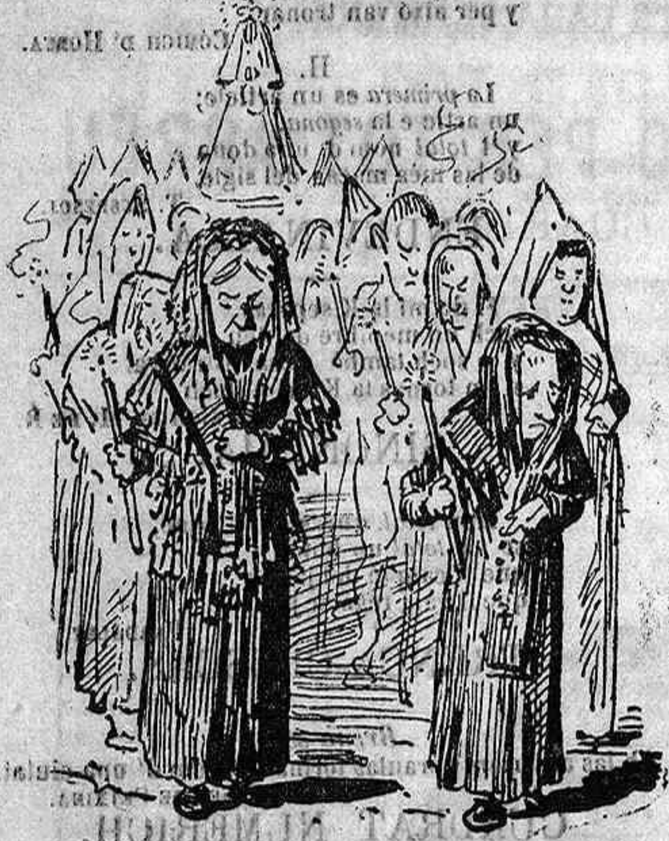
La professó de la Cova—(la dels crachs).