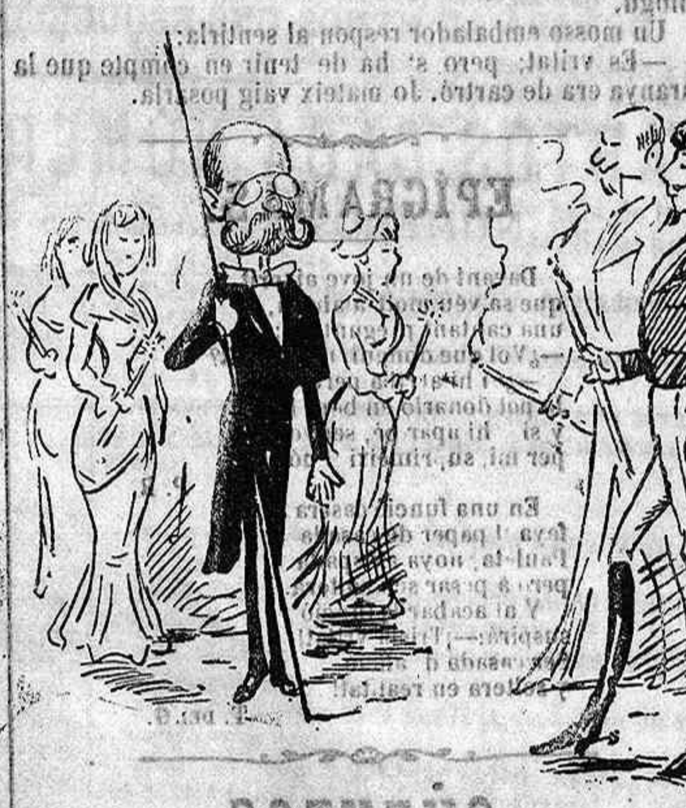
Es redactor del Diari y arregla professons al milenari.