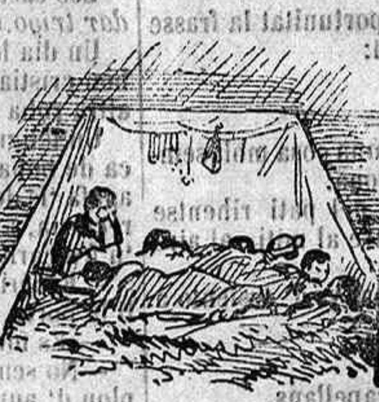
De pela'l metro.