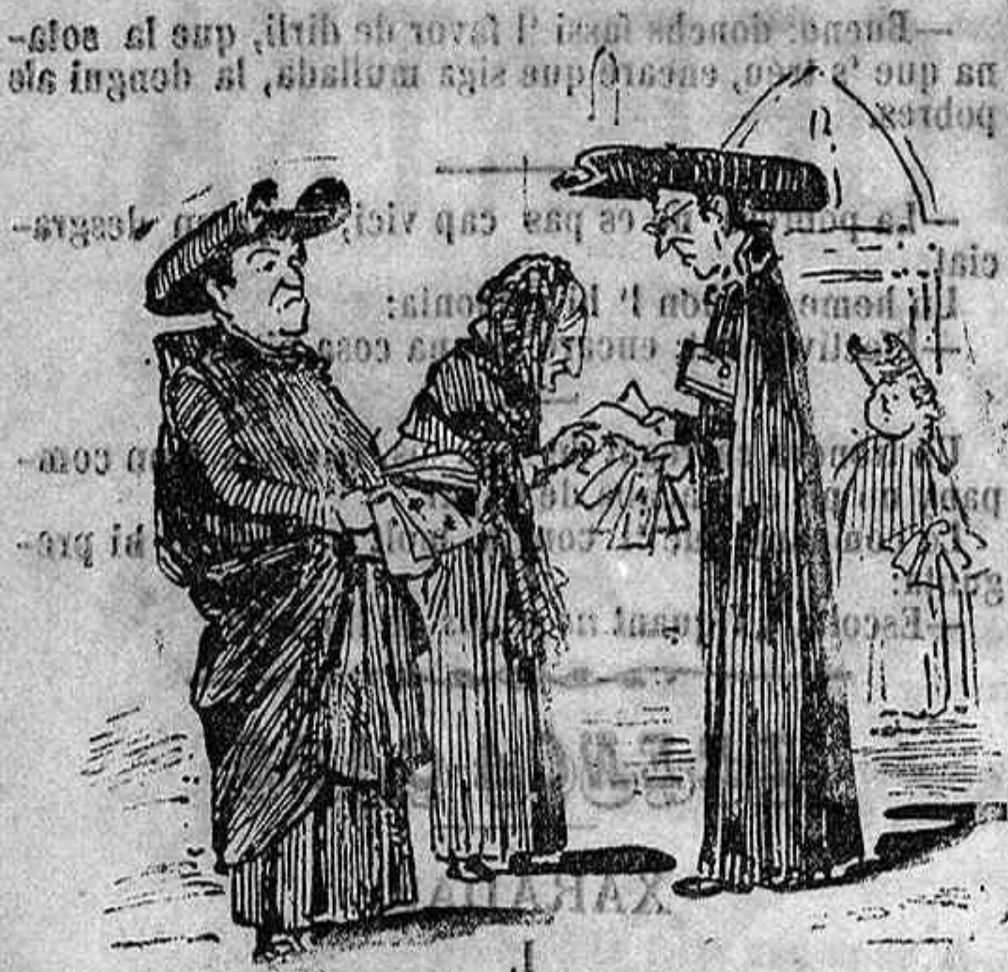
A ralet no més las indulgencias....