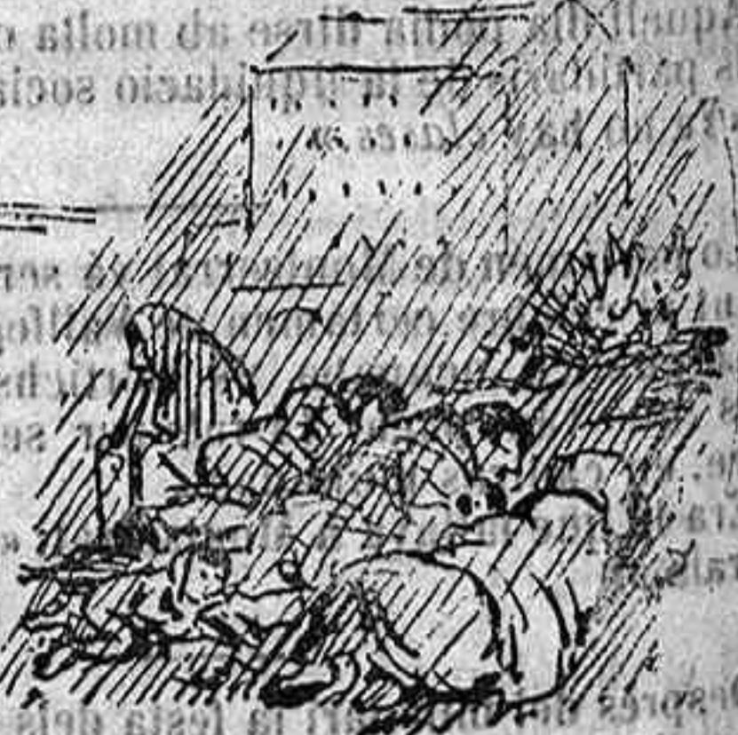
A la bona de Déu.