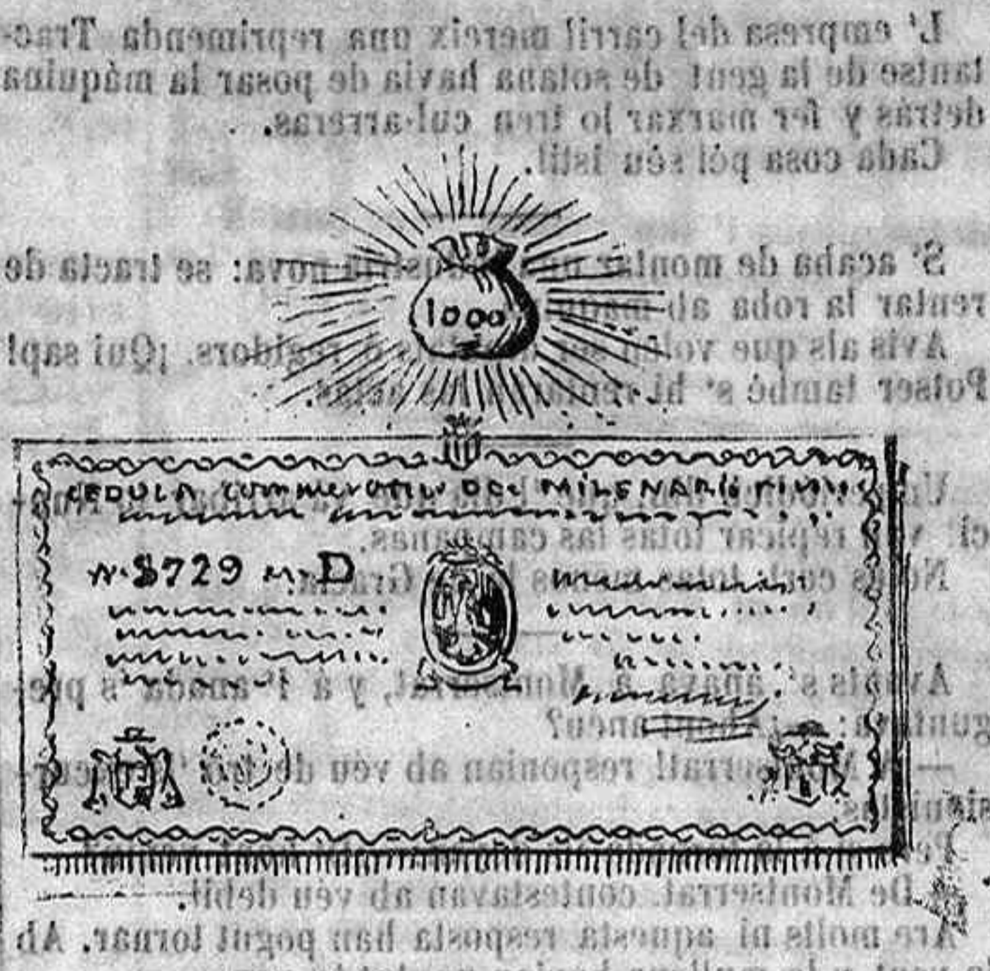
Bitllet per anar al cél, passant per Mont-