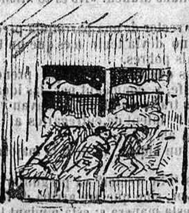
De 6 rals.