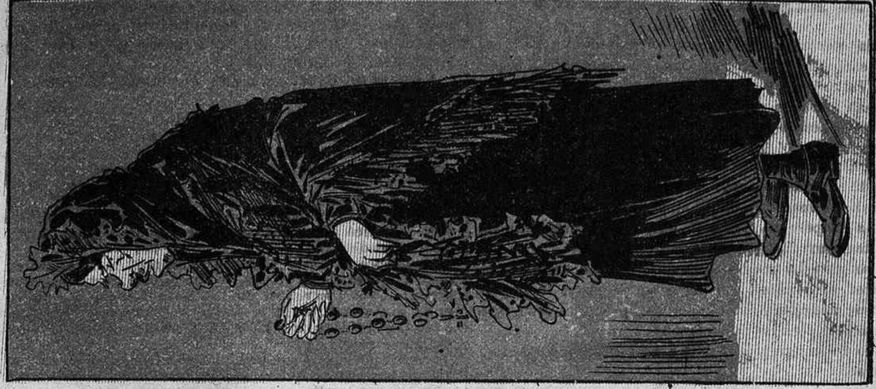
Els mascarons de Cuatresma desde avuy governarán.