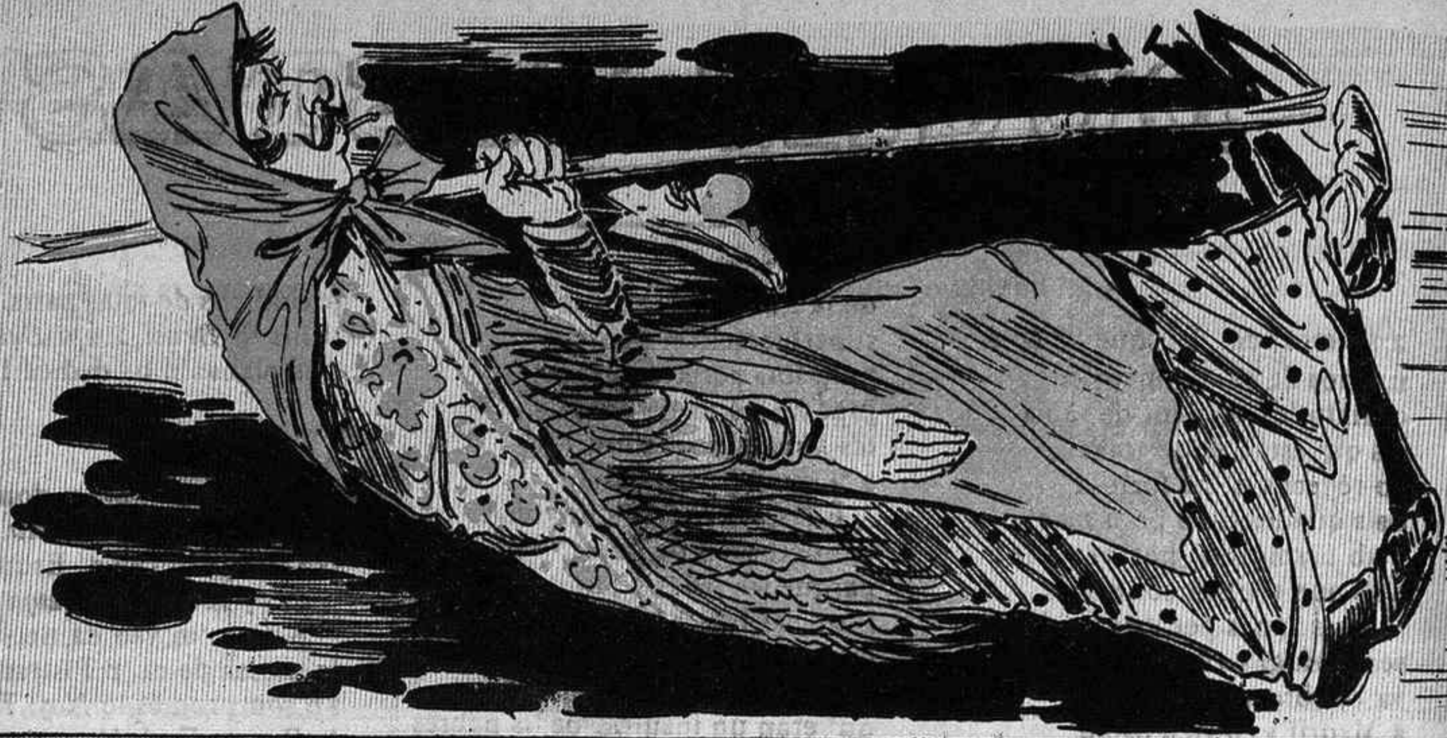
Ja son morts qu'han perdut l'esma