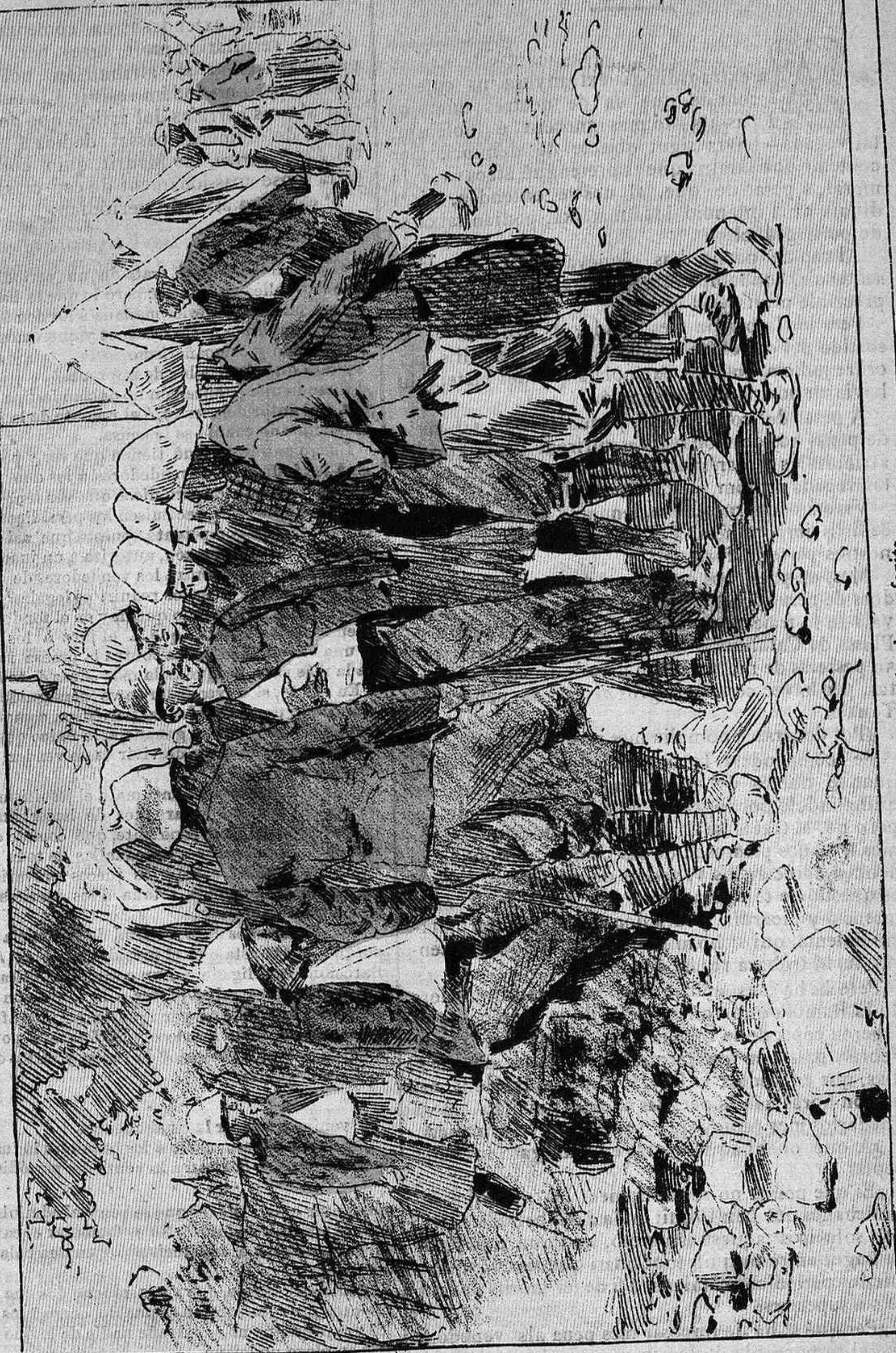
Grupo d'inglesos ferits en acció terrible v ruda, que comentan, afigits, la palissa qu' han rebuda.