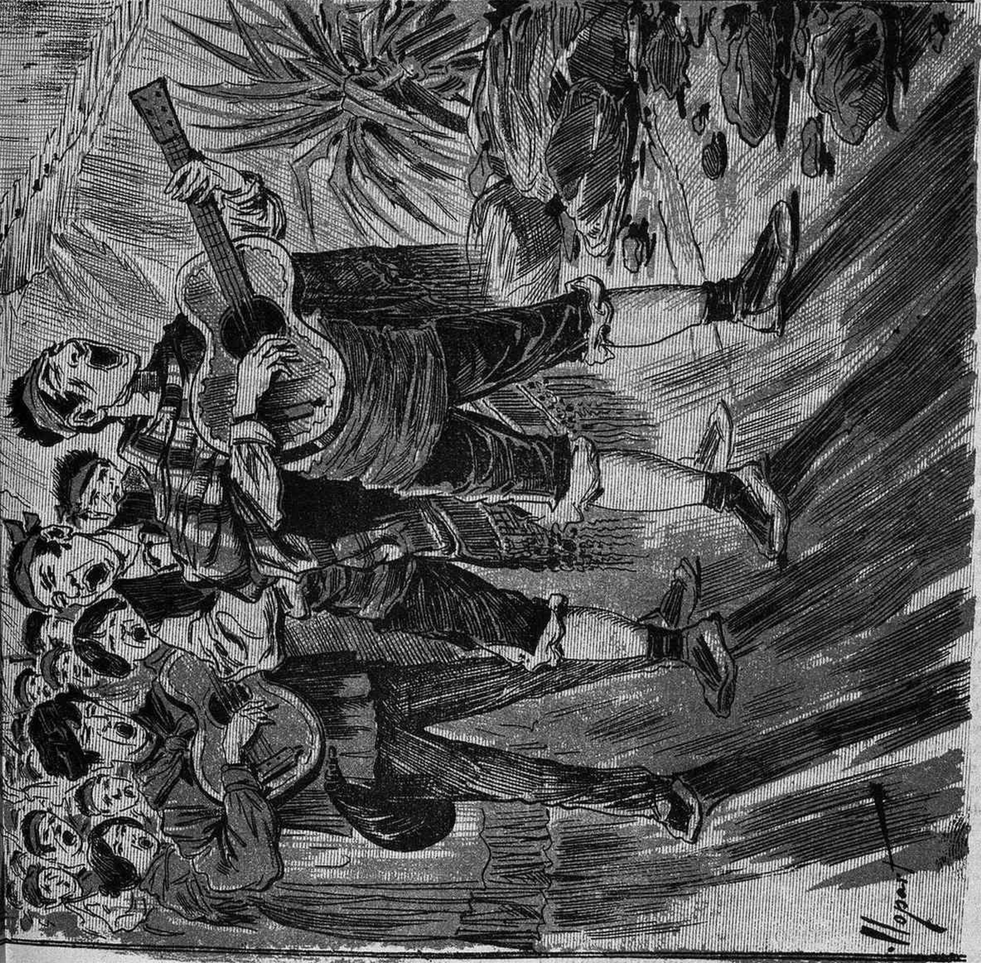
El sol se'n va a la posta. Ab las convulsions póstumas d'un Carnaval ple de tristesses, las alegrías bucólicas del enterro clássich de la Cendra s'han escampat pe 'js voltants de Barcelona. De retorn a la ciutat, no hi falta may el cantar d'una ronda aragonesa que canta a la del Pilar que no quiere ser francesa.