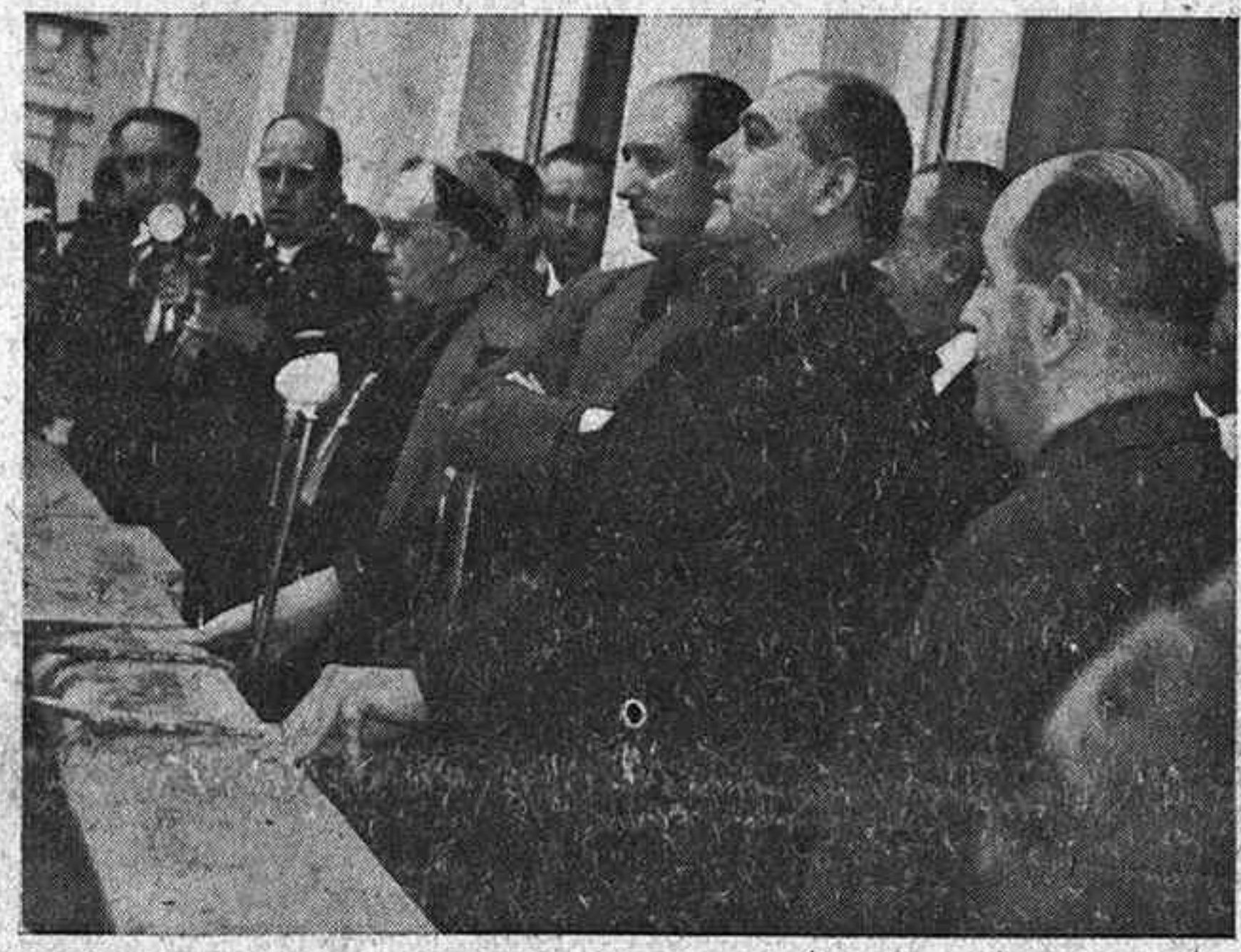
El Sr. Solís en un momento de su alocución desde el balcón principal del Ayuntamiento.

Ayuntamiento, a donde se trasladaron, el alcalde de la ciudad, señor Sanz Vázquez, dió al señor Solís la bienvenida en nombre de la capital, rogándole que trasladase al Jefe del Estado la inquebrantable adhesión del vecindario, y haciéndole presente su absoluta confianza en la trascendencia del Consejo Económico que venía a clausurar.