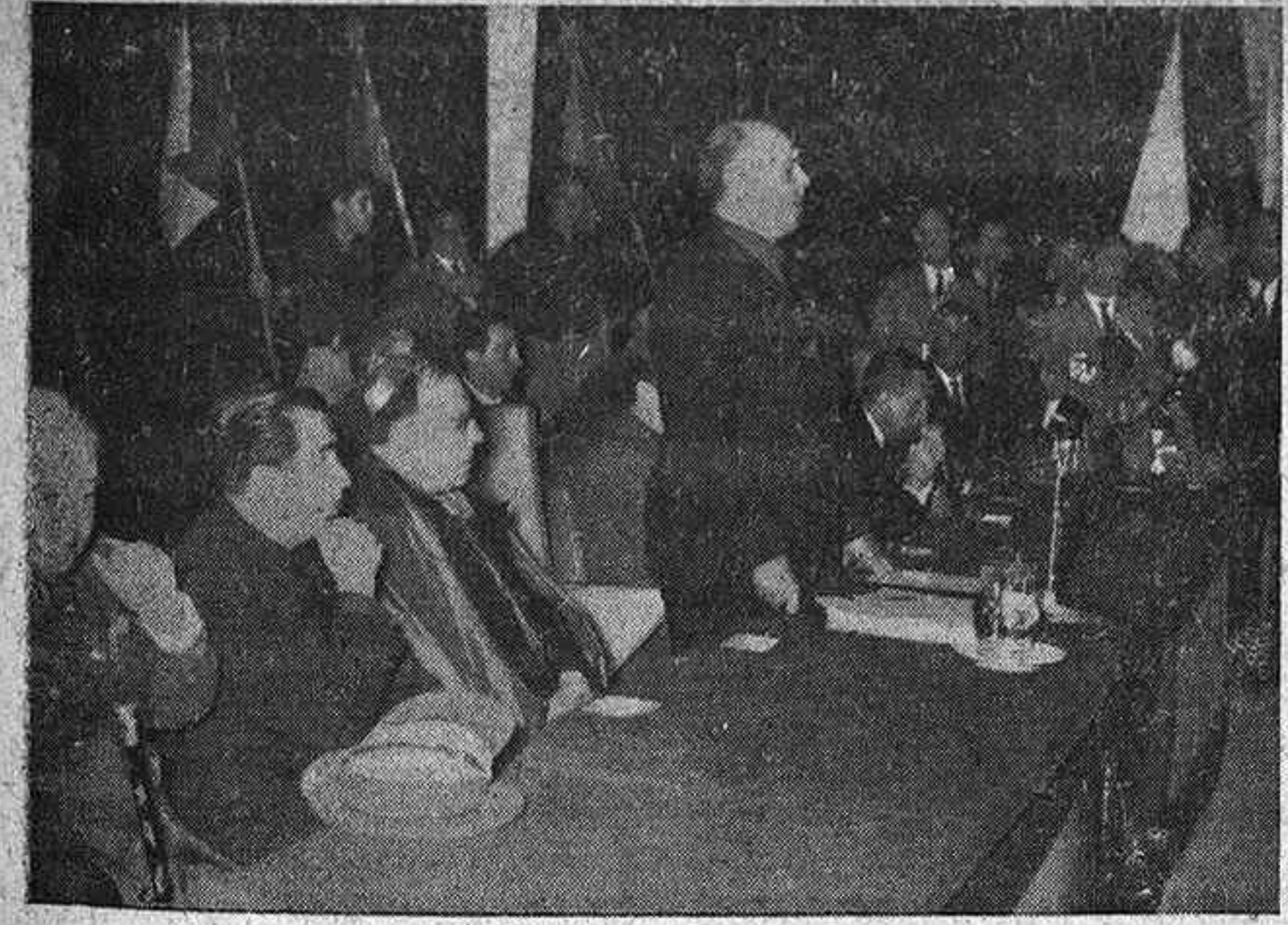
"No me asustan los problemas", afirmó en su discurso del Teatro Liceo el Ministro Secretario General.

El ministro contestó a nuestra primera autoridad municipal, afirmando que su presencia revelaba su preocupación de los problemas que nos afectan, ya que venía a conocer (Pasa a la página segunda)