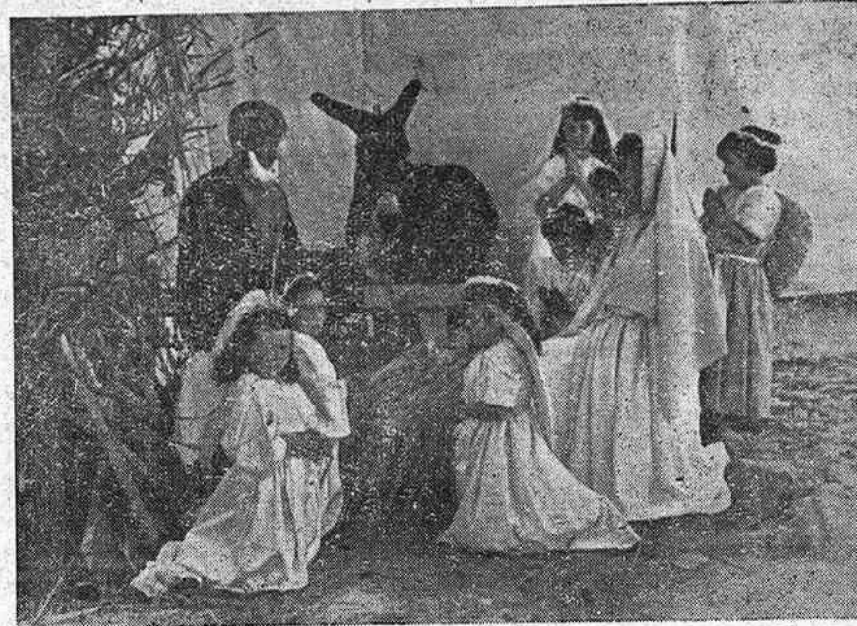
En las calles y las plazas se montaron diversas escenas de ambiente religioso. La del grabado correspondió a la del Nacimiento de Nuestro Señor.

Por fin, el 21, a las cinco de la tarde, llega con nosotros la Virgen Peregrina. Viene precedida por una columna motorizada. En la carretera el pueblo está en masa: clero, autoridades, cofradías, Hijas de María, escuelas, etc., etc., y escoltada por la Guardia Civil pasa a través de distintos arcos hasta llegar a la plaza Mayor donde es colocada en artísti-