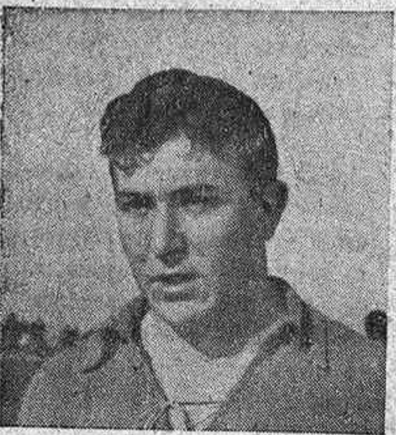
Verjes: Autor del segundo gol local que después sería el de la victoria

manencia, y lo hizo justamente aunque le costara su trabajo y su correspondiente angustia.