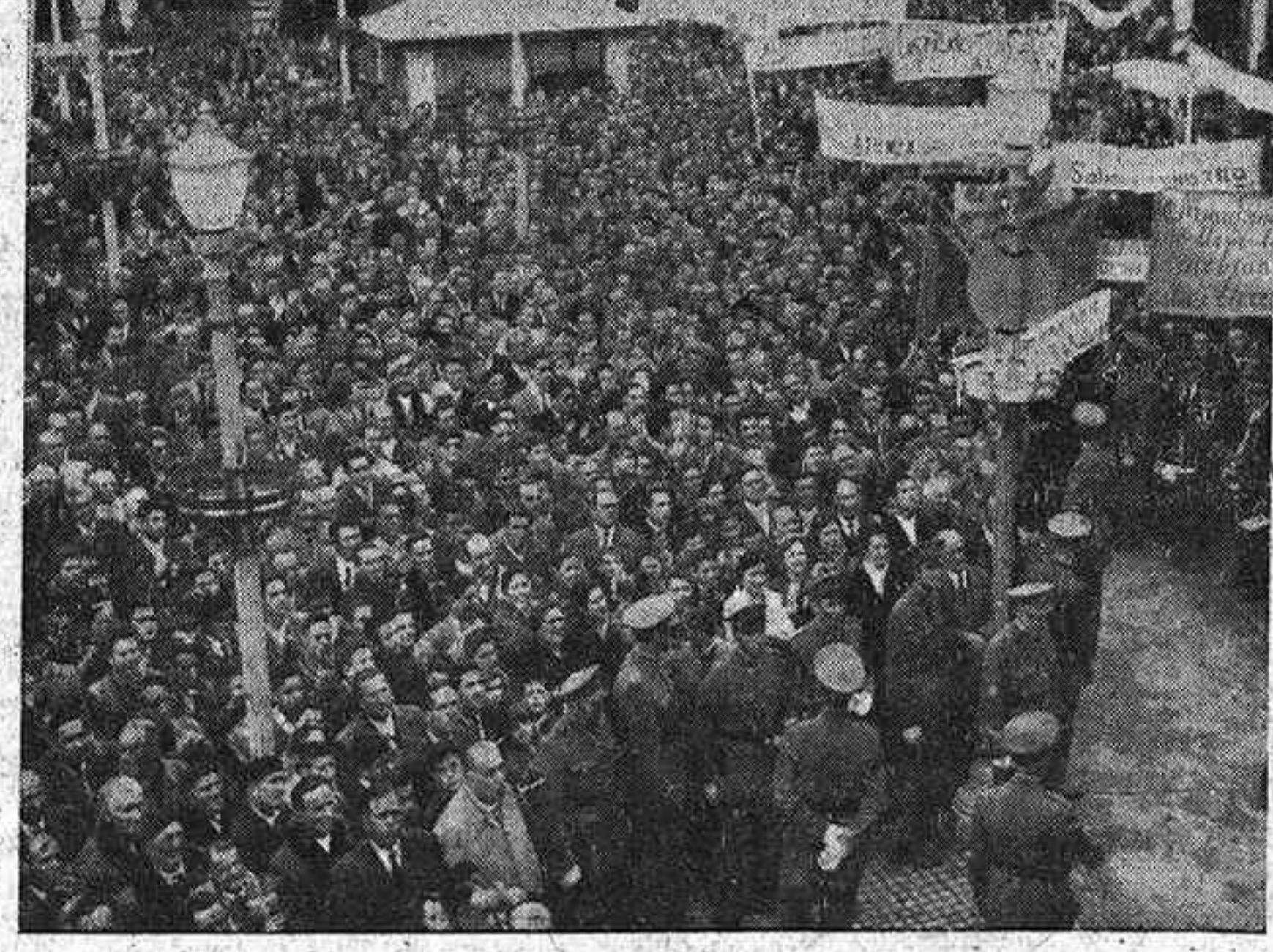
Pancartas y vítores en la plaza Mayor, para refrendar la fé de la provincia en unas conclusiones que hablan de progreso.

En el santuario de Nuestra Señora de la Antigua se ofició una misa en acción de gracias, a cuya continuación, en el salón de sesiones del Ayuntamiento, se procedió a la imposición de las mencionadas insignias, bajo la presidencia del excelentísimo (Pasa a la página segunda)