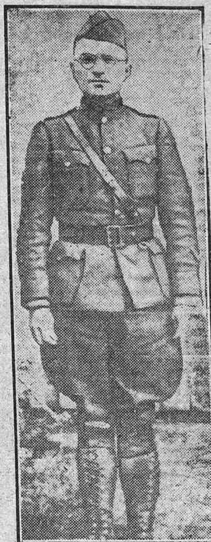
El Presidente Truman fué durante la primera guerra mundial capitán de Artillería, y como tal luchó en el frente francés

Los pactos de Río y del Atlántico le obligará a defender a la mayor parte del globo