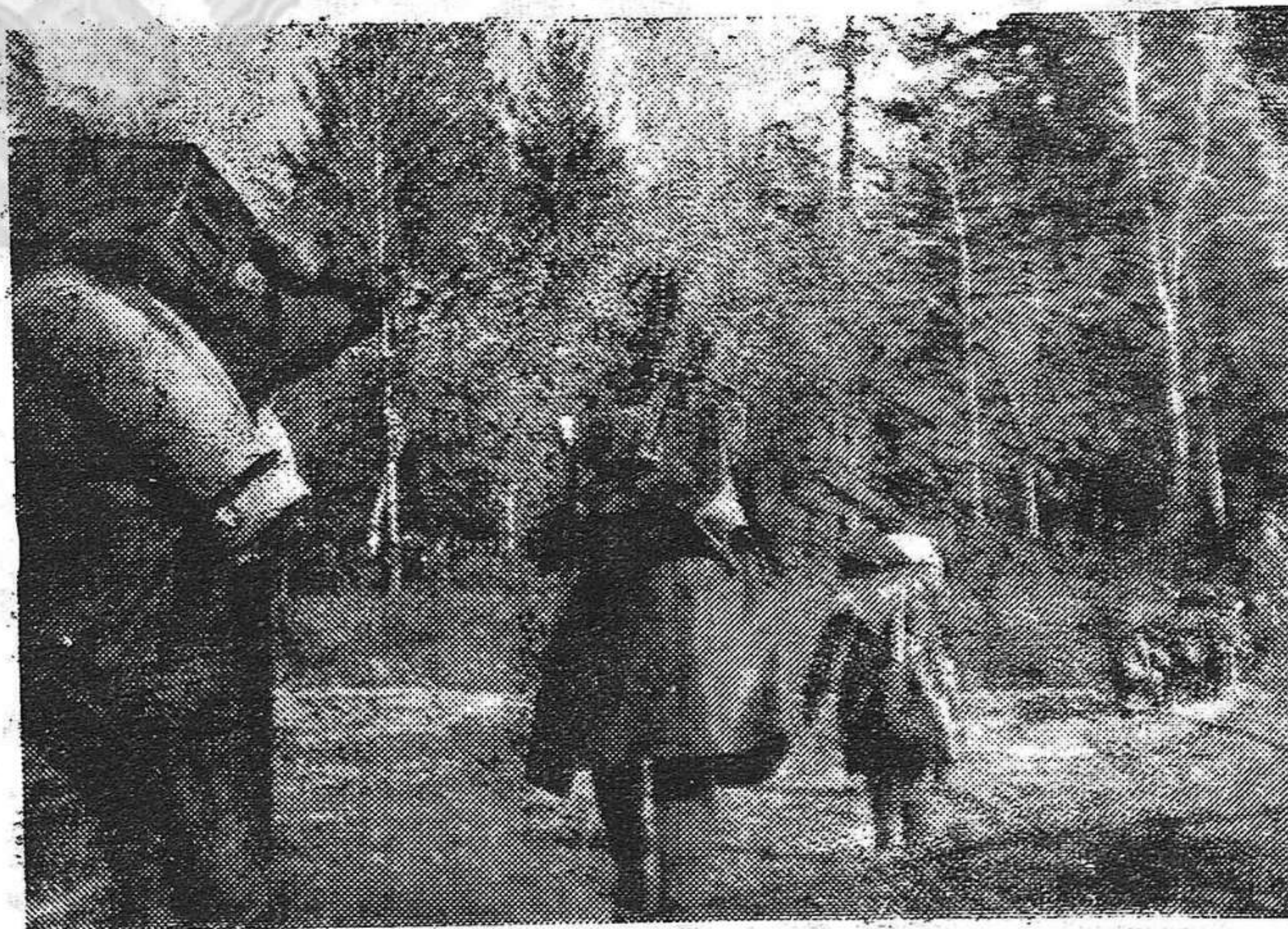
ESCENAS DEL FRENTE. — Nuestras fuerzas en un avance

En estas hojas se dice, entre otras cosas: "La rebelión de los militares españoles ha servido de estímulo a otros Franco y Mola en Méjico".