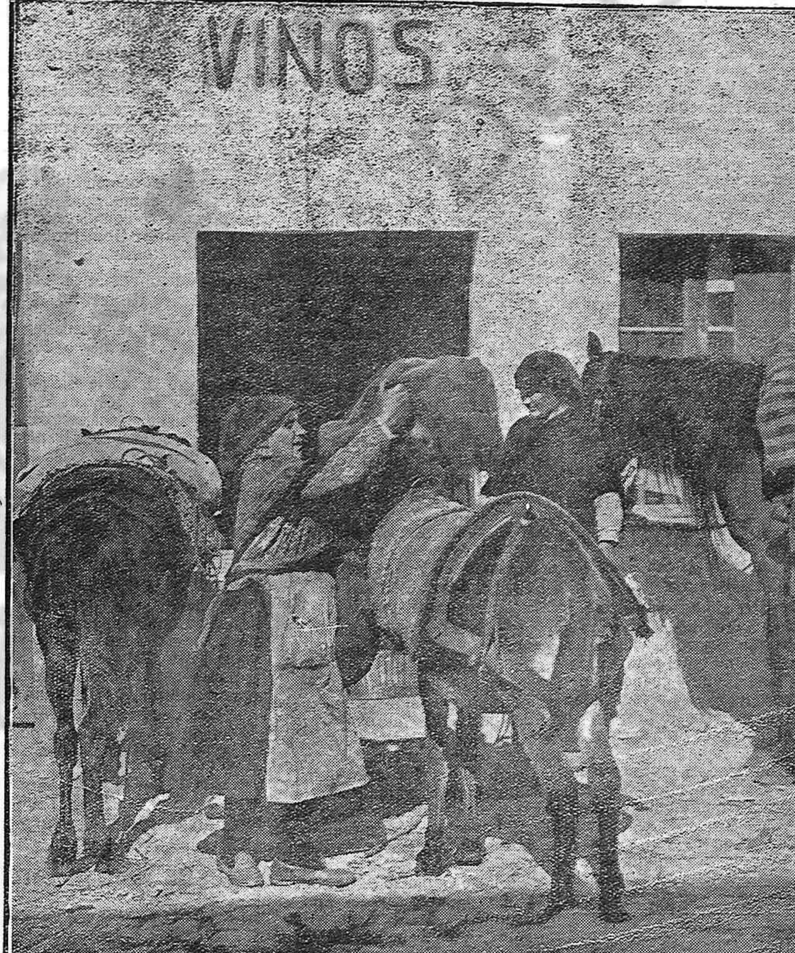
El mágico objetivo de Pepe Lamela captó admirablemente esta escena típica muy corriente en los alrededores de la feria un día como el de hoy en el que San Froilán llama a la capital al campesino. La anterior fotografía figura en la exposición que Lamela tiene abierta en el Círculo de las Artes.

entendían una maniobra de la coalición Azaña-socialista y también por su marcado partidismo en favor del socialismo. Y decían: le elegimos todos presidente de todos, no solamente para los suyos. En la jornada de hoy se ha jugado todo su prestigio y lo ha perdido. Este Parlamento se acaba de convertir en una Convención. El Sr. Algo a, que escuchaba, dijo que él había abandonado el salón por la misma causa. Injusticias y atropellos El Sr. Soriano decía que todo había sido una arbitrariedad, un cúmulo de injusticias y atropellos. Él no puede desconocerlo, que el Parlamento lo componen el Gobierno y los diputados. ¿No hay Gobierno? No hay tampoco Parlamento. Es cosa, por tanto, de llevar el caso Besteiro al Tribunal de Garantías. Animación en los pasillos.—Baja y ruín El señor Feced, hablando con los periodistas sobre lo ocurrido en la sesión de esta tarde, dijo: —La maniobra que ha realizado en la tarde de hoy el señor Besteiro ha sido baja y ruín. Por otra parte, yo no creo que eso pueda coartar la libertad del presidente de la República en sus decisiones. —Desengañese usted; el Sr. Le-