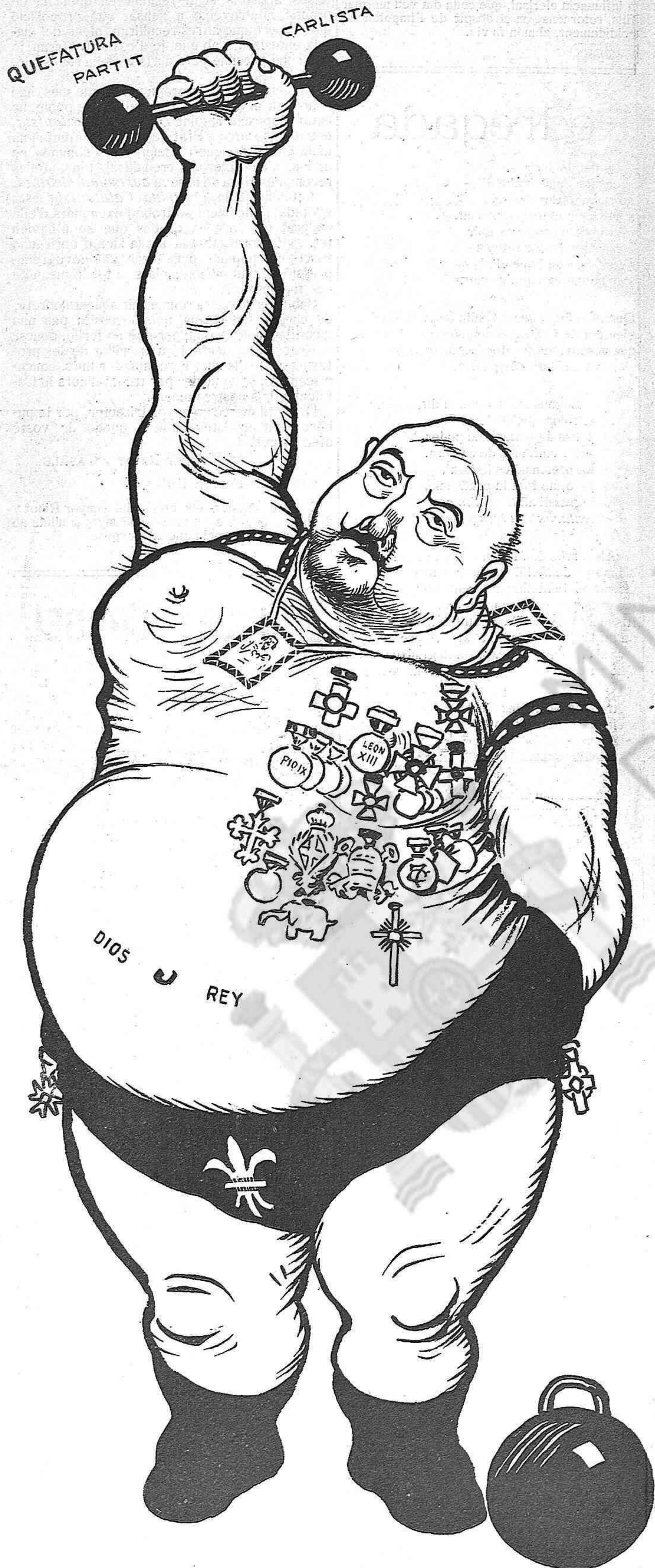
Arreparin que no sua!...