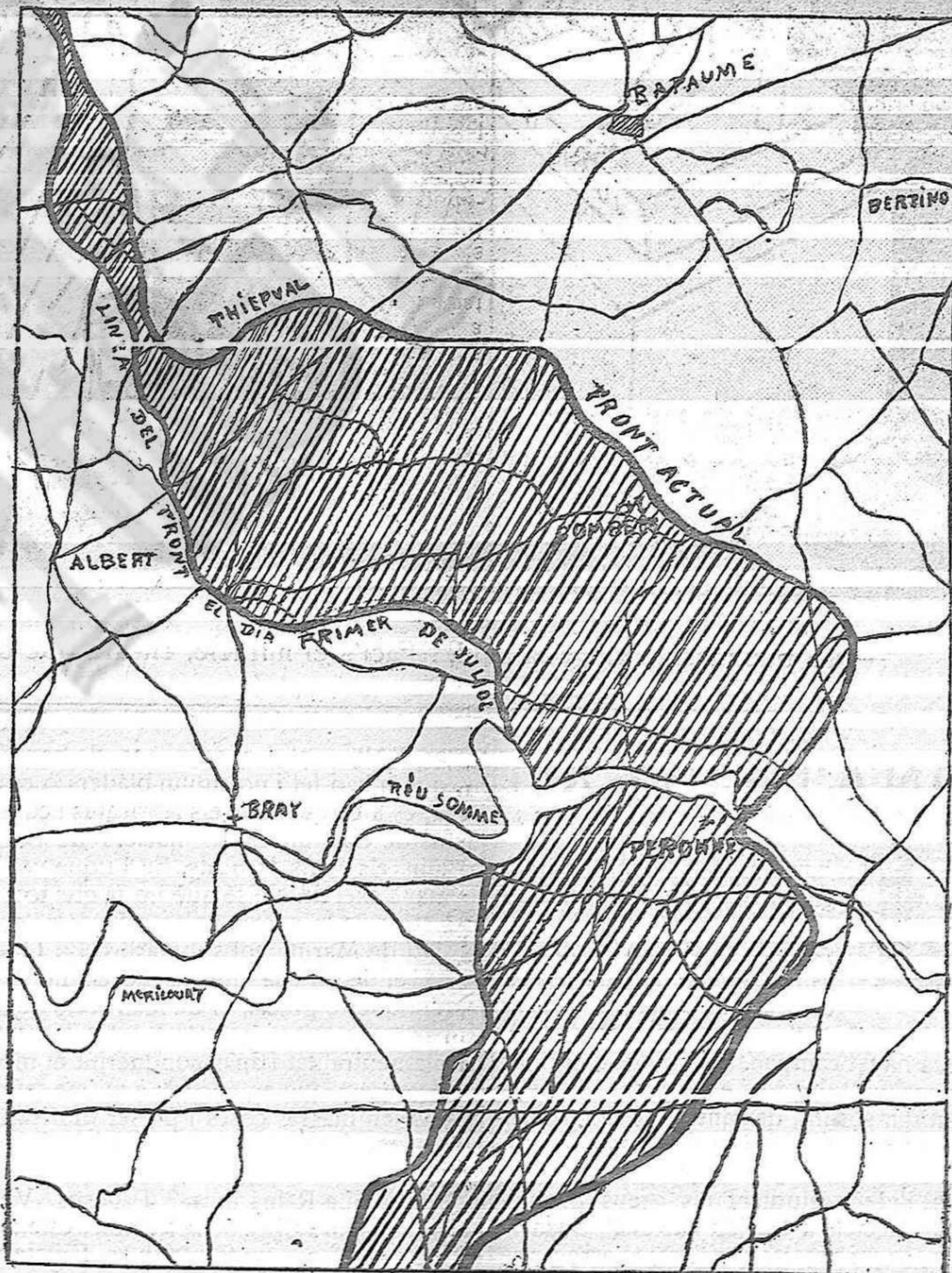
Gràfic del avenç franco-anglès en la regió del Soma. Tot el terreny que representa la part fosca del mapa (i molt més que n'han guanyat darrerament), ha sigut recobrat en pocs dies per les tropes aliades.

Cavalla, ocupada pels búlgars, ha estat novament bombardejada per forces navals aliades.