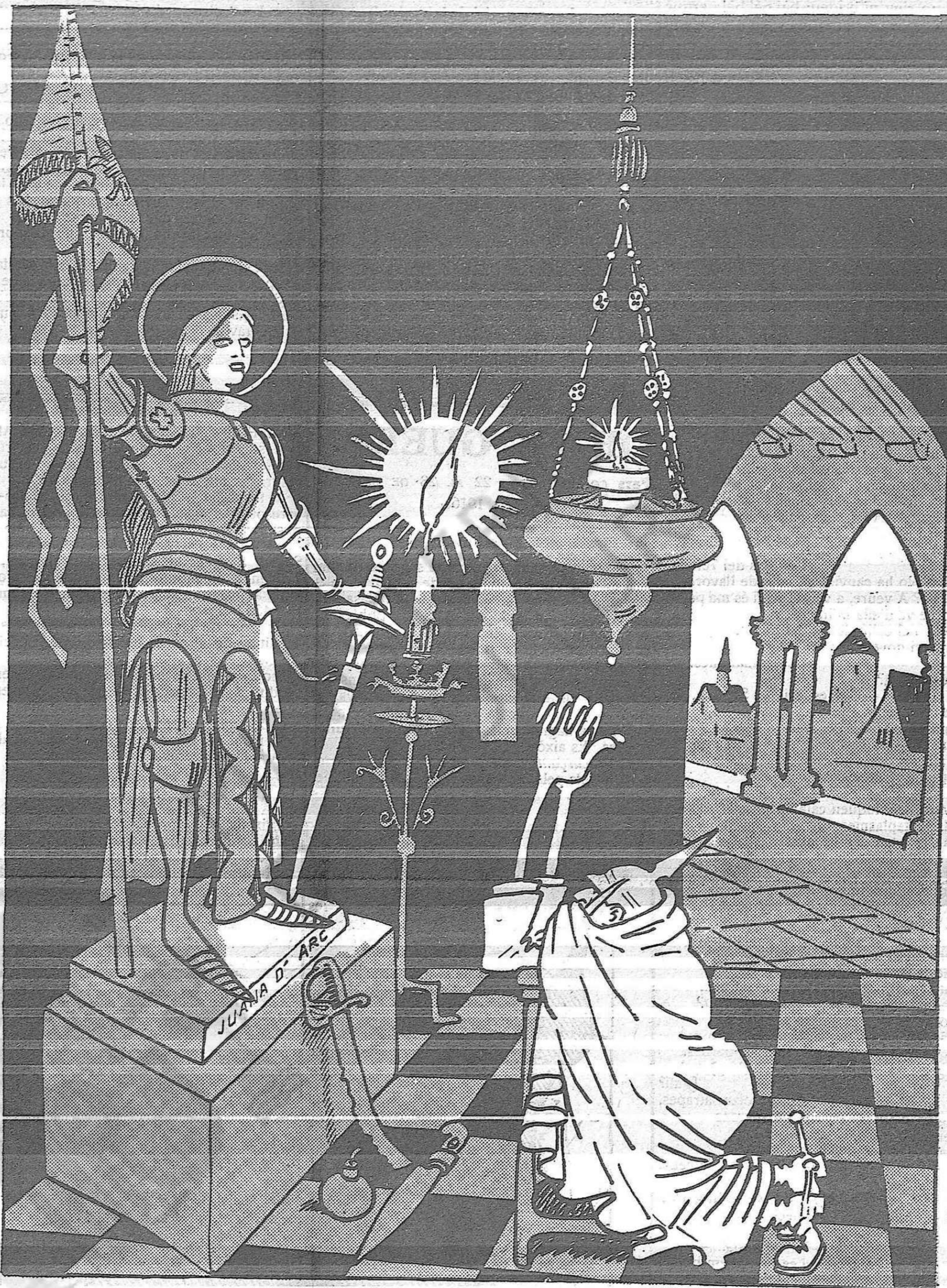
—No puc més!... Vinga la pau!... Faci's el miracle, encara que el facis tu!...