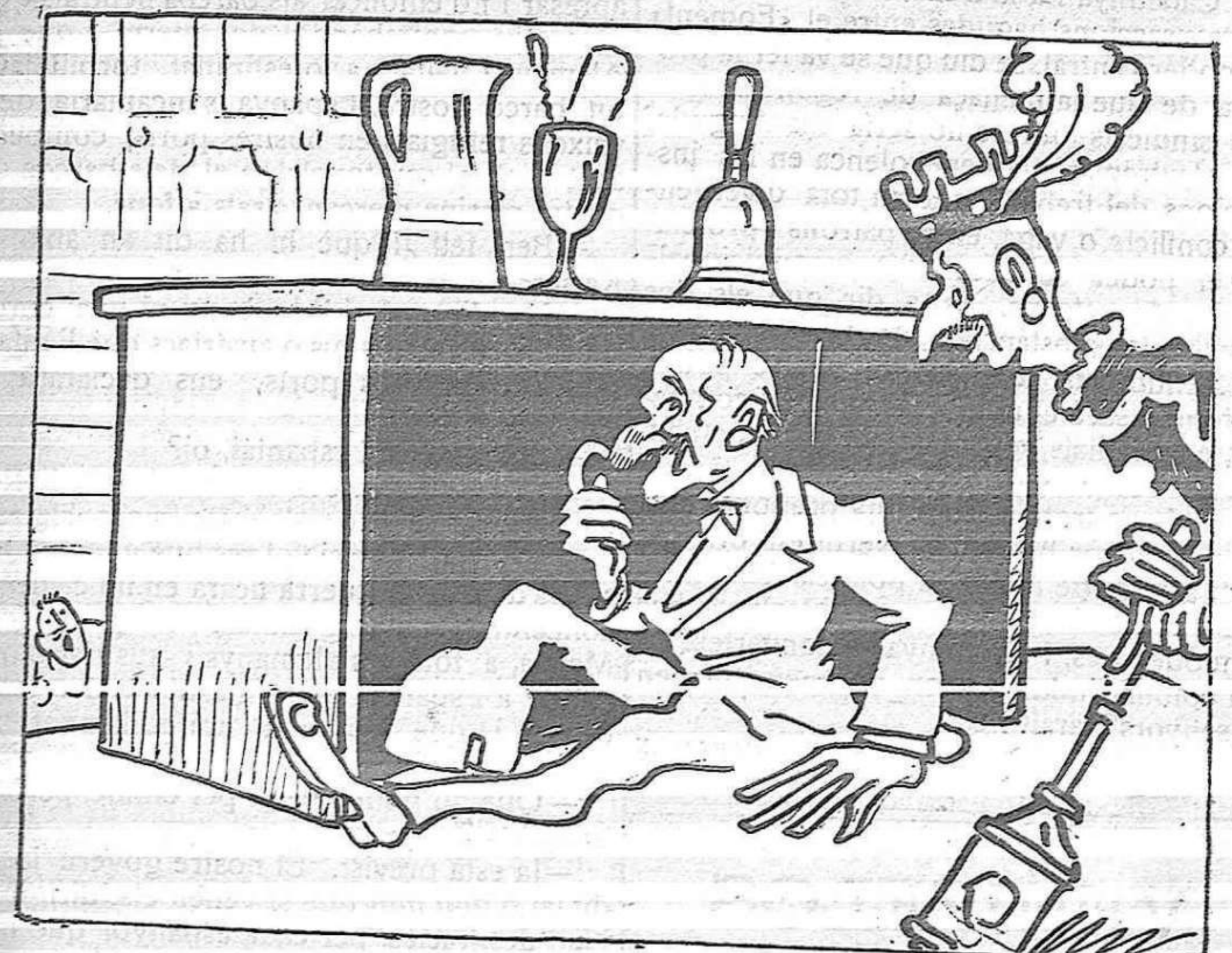
— I vostè? — Jo no'n tinc cap d'amic. A mi que'm deixin estar que'l meu mal no vol soroll.