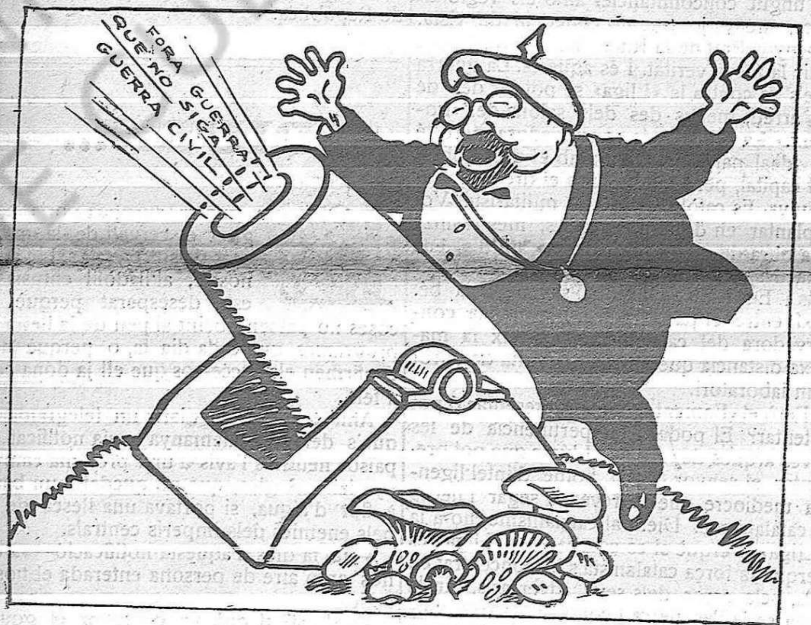
—Hem de votar per l'Alemanya!