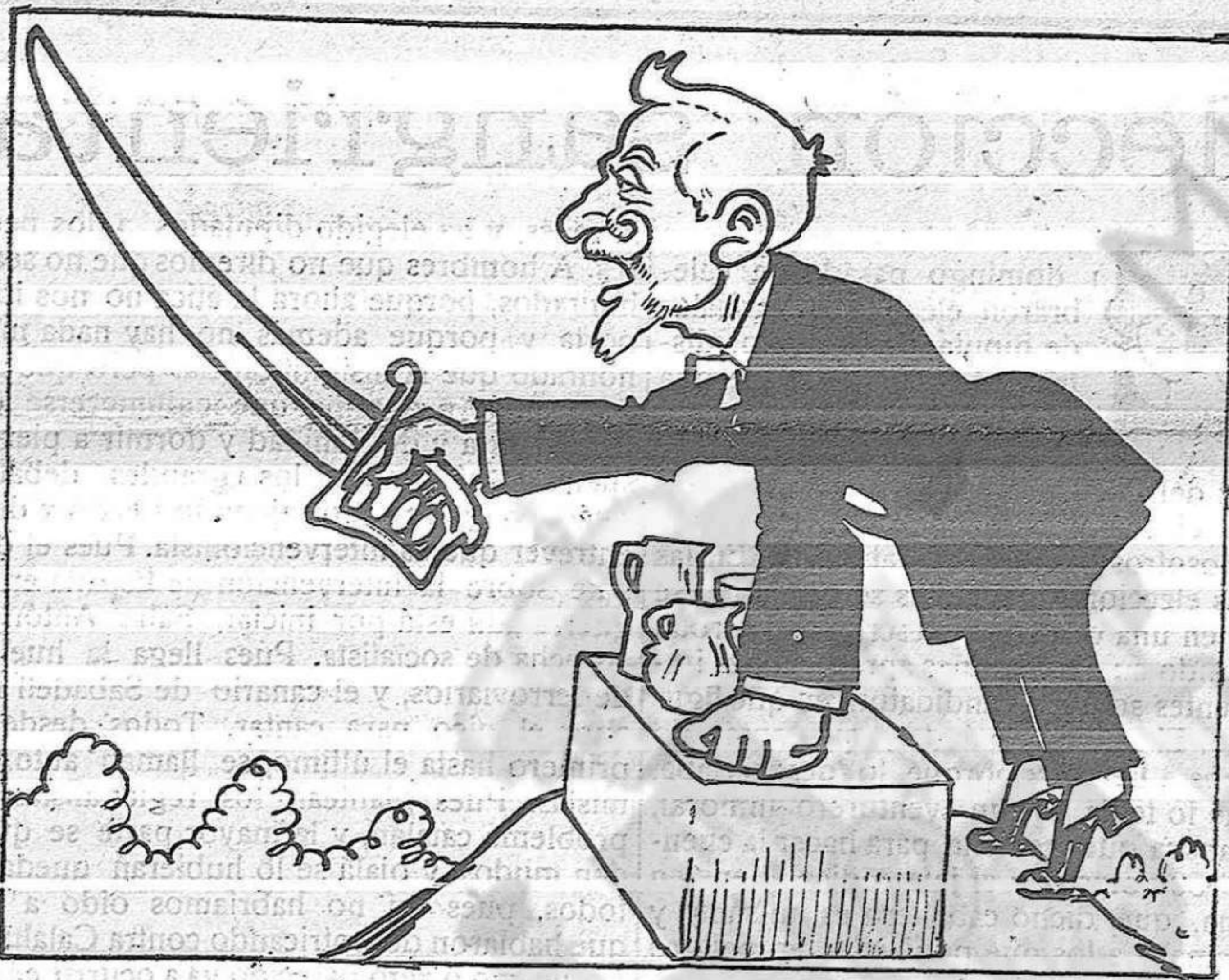
—Hem d'estar be amb l'Anglaterra!