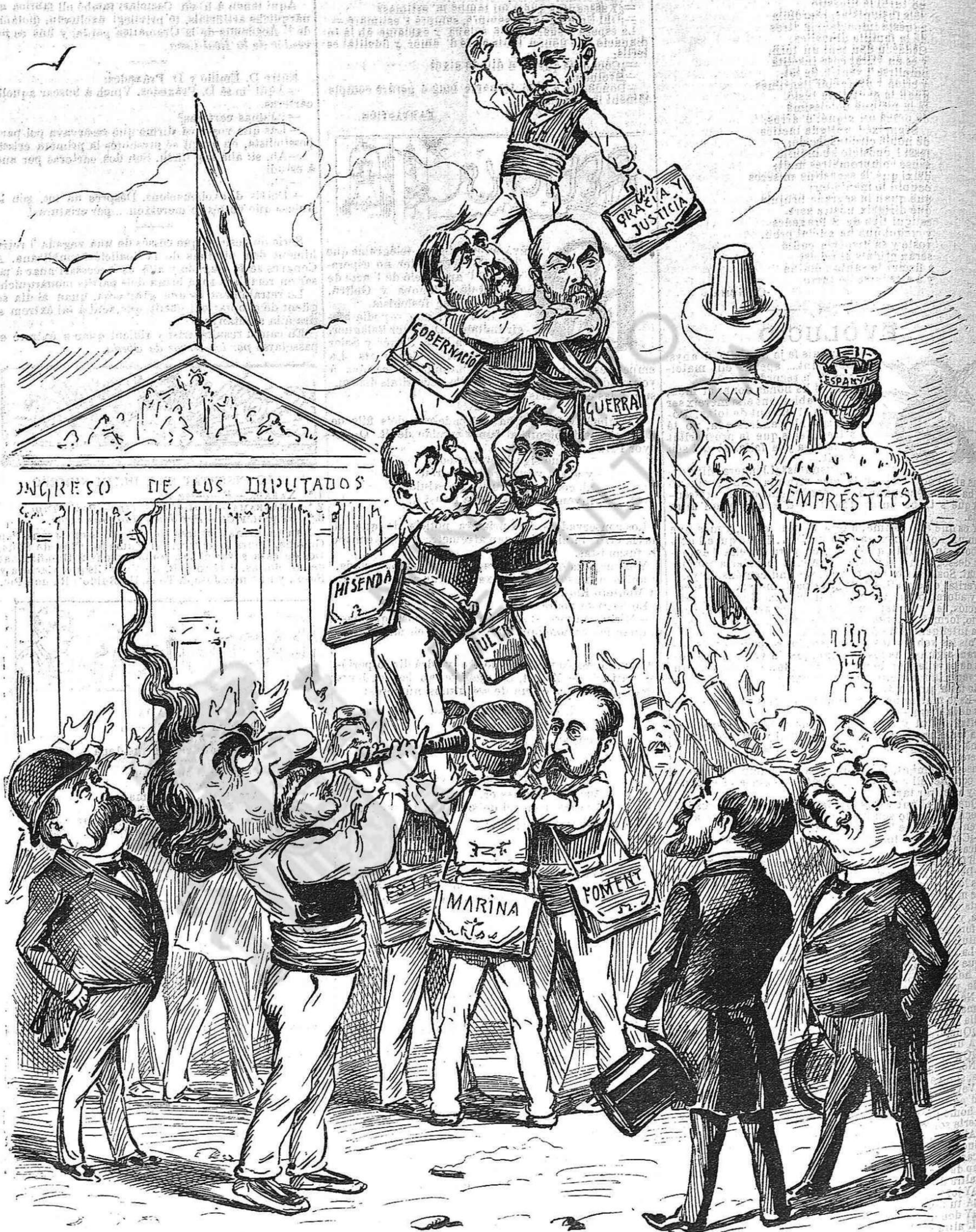
Va formarse aquest castell ab los xiquets més notables, y ja está si cau no cau y se 'n va tot al diable.